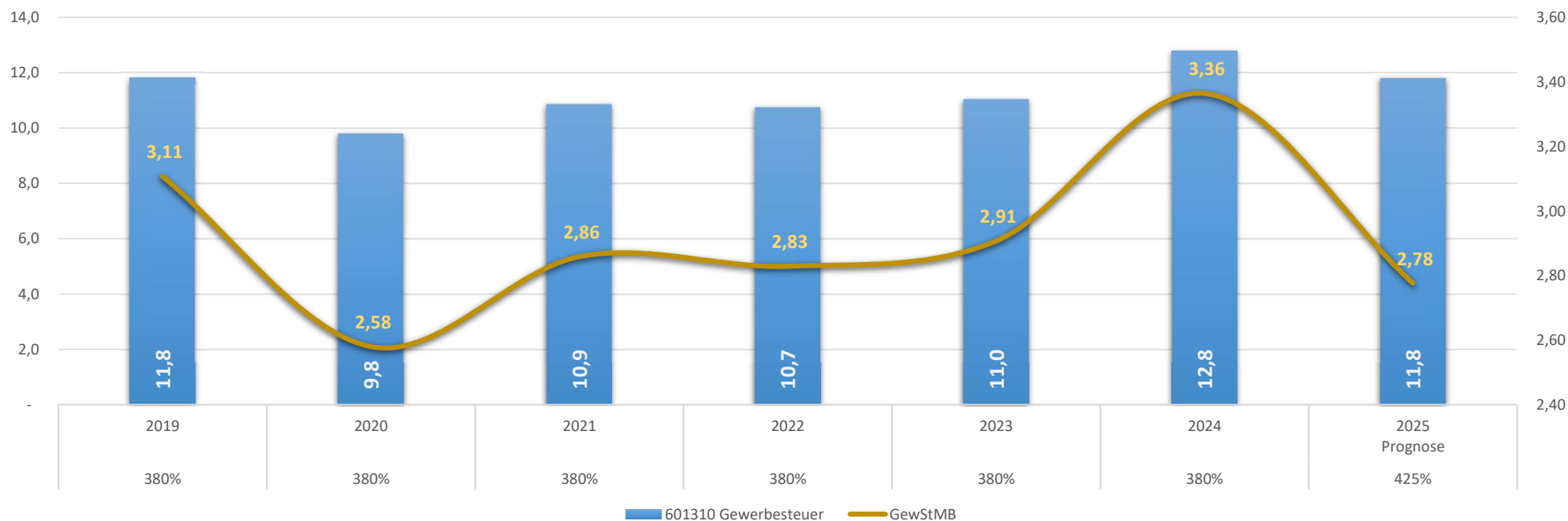
Gewerbesteuereinzahlungen und Gewerbesteuermessbetrag Werte in Mio €