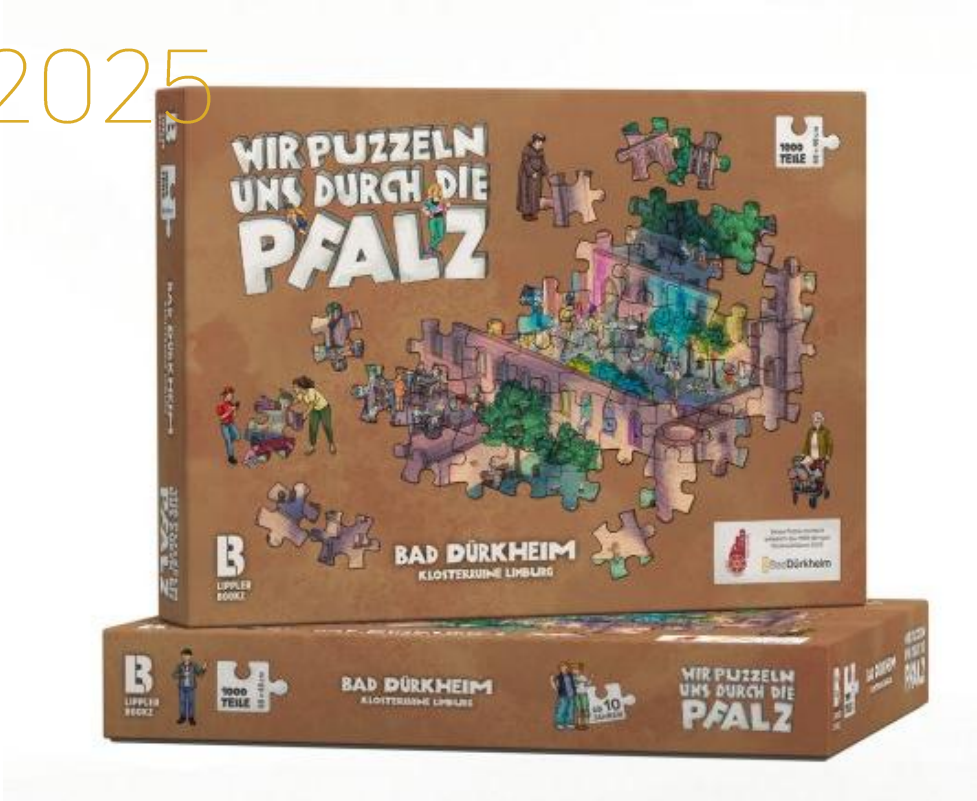
Limburg Jubiläum, Merchandise