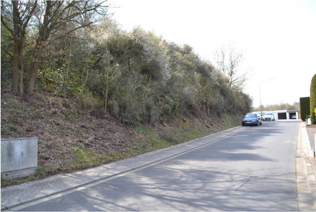
Böschung der Änderungsfläche zur Justus-von-Liebig-Straße