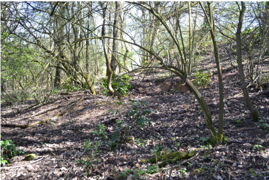
Gehölz auf der Änderungsfläche