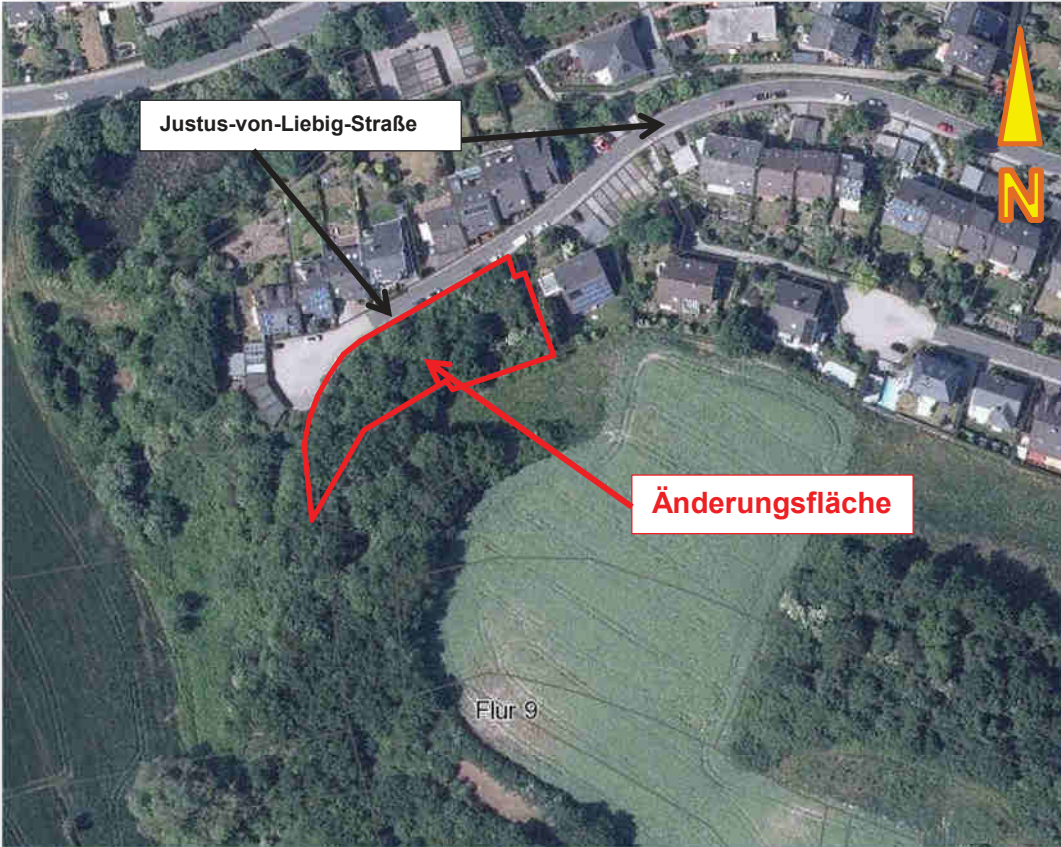
Kartengrundlage: Auszug aus LANIS, Luftbild vom 15.06.2015