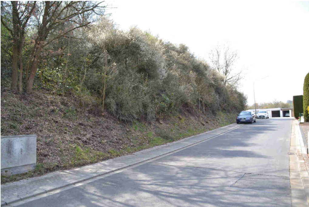
Böschung der Änderungsfläche zur Justus-von-Liebig-Straße