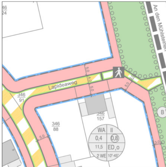
Abbildung 3: Gegenüber der konkreten Änderung Rechtsverbindlich

Wie in Kapitel 1.2 dargelegt, soll mit der 5. Änderung lediglich die in den Plan eingezeichnete Abgrenzung zwischen einer Verkehrsmischfläche und einem Fußweg verschoben werden. Konkreter Anlass ist eine geplante Zufahrt auf das südlich angrenzende Flurstück. Der Pkw-Stellplatz bzw. die Garage des geplanten Bauvorhabens wäre nur über den Fußweg erreichbar und widerspräche den Festsetzungen des Bebauungsplans. Daher wird zur besseren Erschließung beider an den bisherigen Fußweg angrenzenden Grundstücke die Abgrenzung zwischen der Verkehrsmischfläche und dem Fußweg nach Osten verschoben. Die Unterbrechung der befahrbaren Verkehrsfläche und der Straße „An den Mühlsteinen“ für den Fahrverkehr bleibt erhalten.