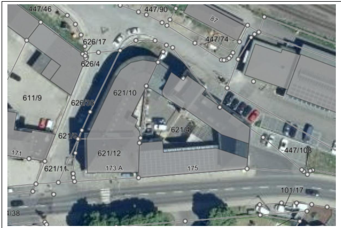
Abb.1: Lage des Plangebietes (Auszug aus LANIS-RLP), unmaßstäblich

Topographisch gesehen fällt der Änderungsbereich leicht zur „Koblenzer Straße“ hin ab.