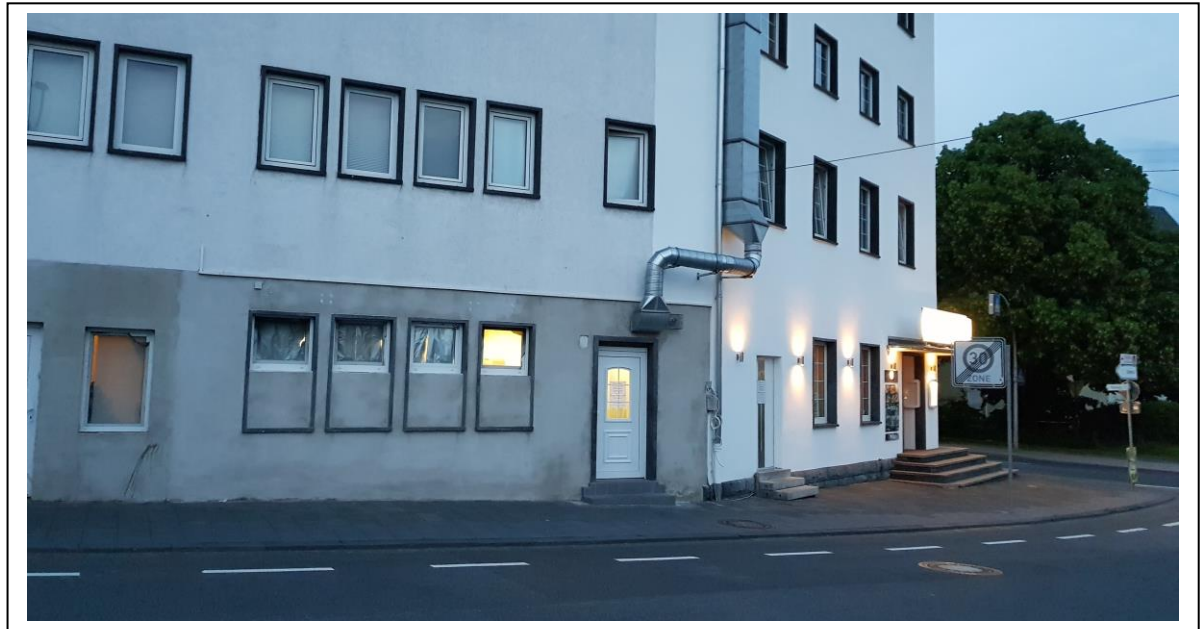
Abb. 3: Bestehende Situation

Grünflächen oder -bereiche sind von der künftigen Nutzung nicht betroffen.