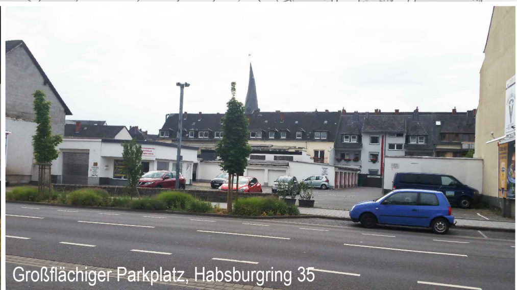
Großflächiger Parkplatz, Habsburging 35