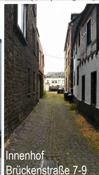
Innenhof Brückenstraße 7-9