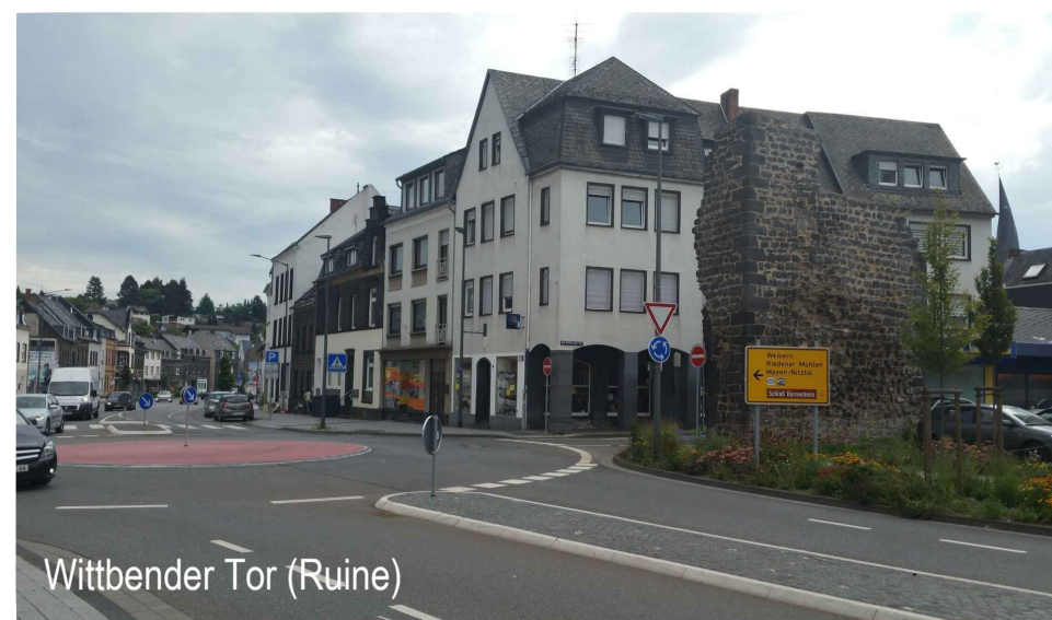
Wittbender Tor (Ruine)