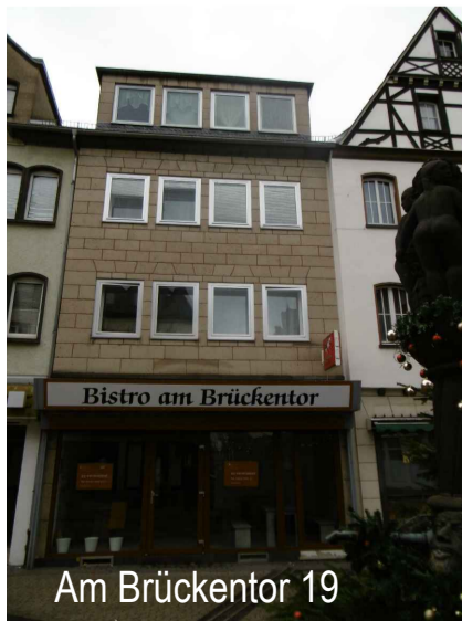
Am Brückentor 19