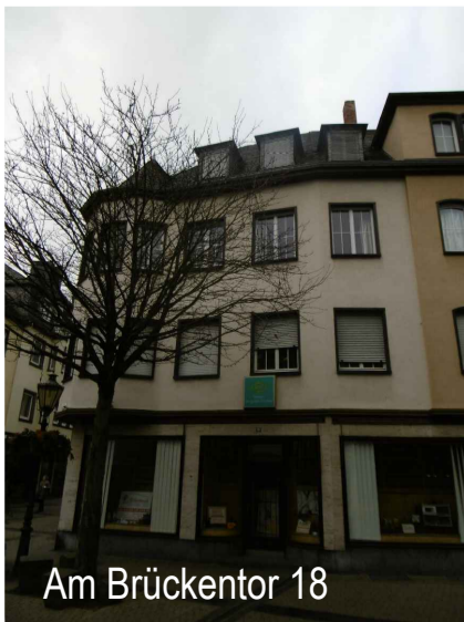
Am Brückentor 18