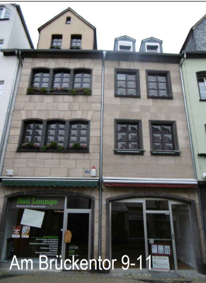
Am Brückentor 9-11