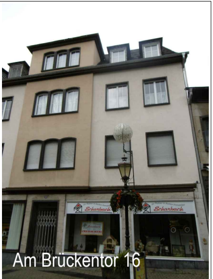
Am Brückentor 16