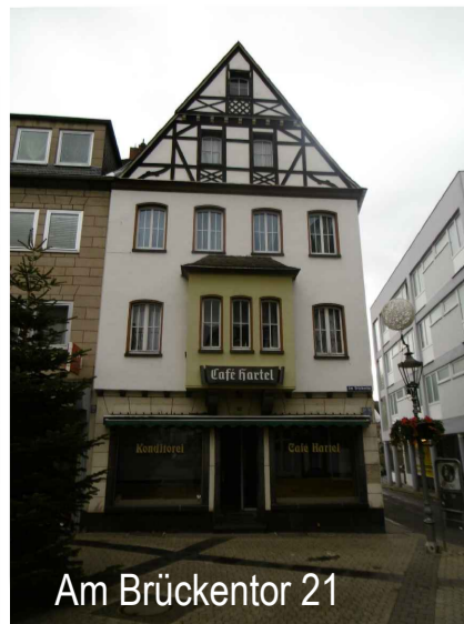
Am Brückentor 21