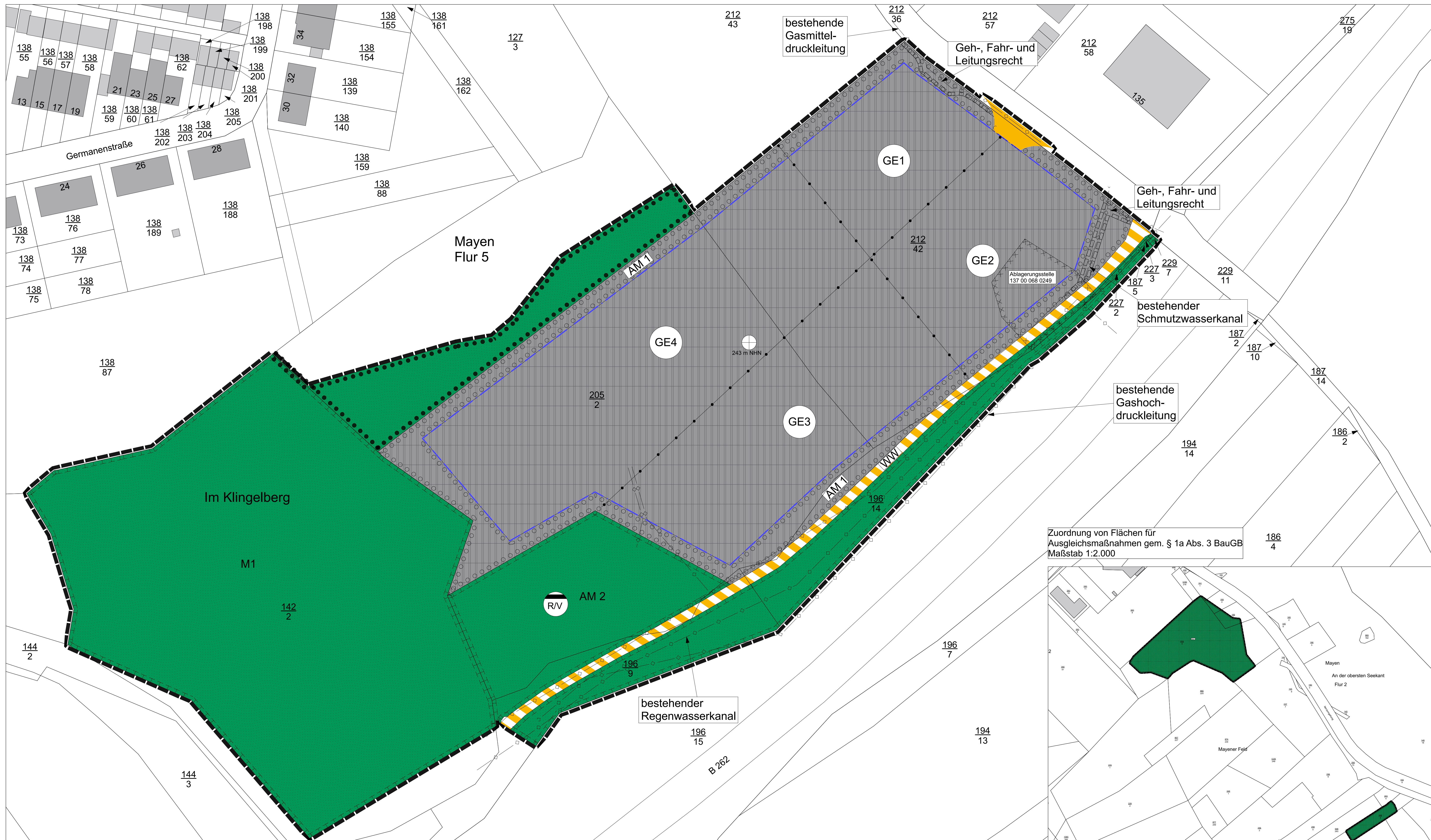
Zuordnung von Flächen für Ausgleichsmaßnahmen gem. § 1a Abs. 3 BauGB Maßstab 1:2.000