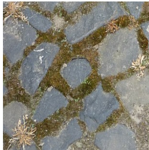
*1: Fugenreiches Basaltpflaster