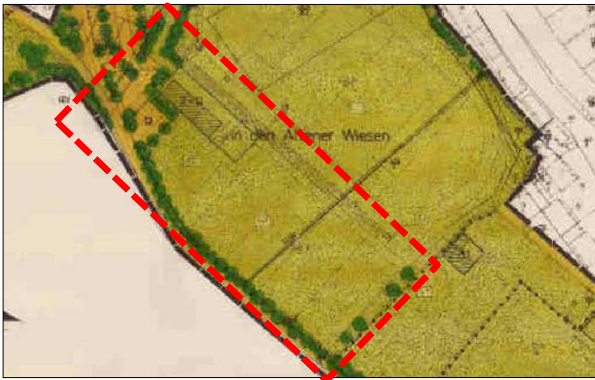
Abb.: Auszug aus dem rechtsverbindlichen Bebauungsplan