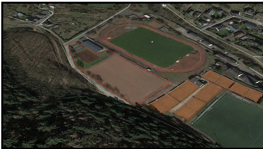
Abb.: Abgrenzung des Untersuchungsgebiets (rote Umrandung) 1

Das Plangebiet selber ist heute bereits als Sportanlage in intensiv anthropogener Nutzung. Der südliche Teil ist ein Ascheplatz der als Fußballfeld genutzt wird. Am westlichen Rand befindet sich eine Baumreihe mit Brusthöhendurchmesser bis höchstens 40 cm. Im nördlichen Teil befindet sich Fettwiese, ein weiterer Ascheplatz sowie Parkplätze. Zusätzlich befindet sich am nördlichsten Punkt der Planfläche ein Einzelbaum der laut Textfestsetzung erhalten bleibt.