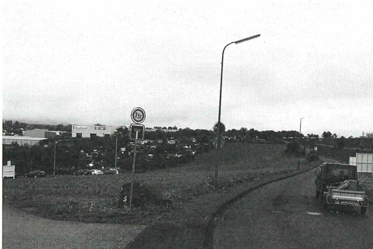
Abbildung 6: Blick aus südlicher Richtung auf die Greening-Fläche mit Laubenkolonie und Gewerbegebiet