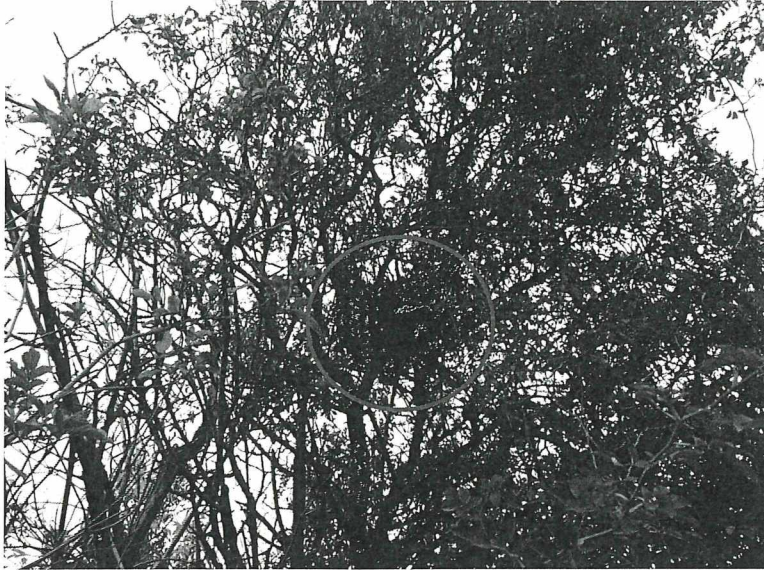
Abbildung 5: Elsternest im Gehölzbereich inmitten der Ackerfläche (vgl. Abb.4)