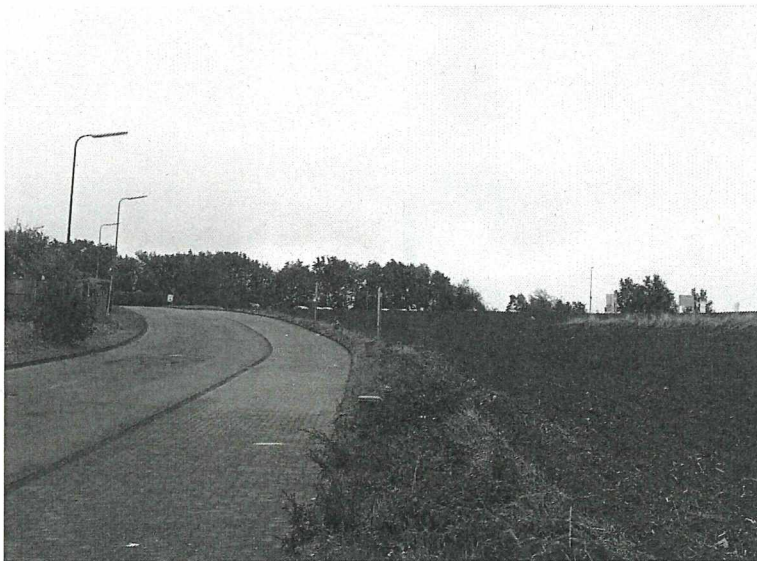
Abbildung 3: Blick über die Erschließungsstraße mit Saumstruktur und Ackerfläche

In den folgenden Abbildungen wird ein Überblick über den Planungsraum gegeben: