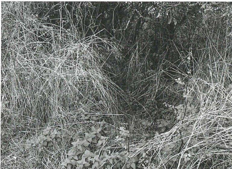
Abbildung 8: Pass von Fuchs und sonstigen Prädatoren im Gehölzbereich inmitten der östlichen Ackerfläche