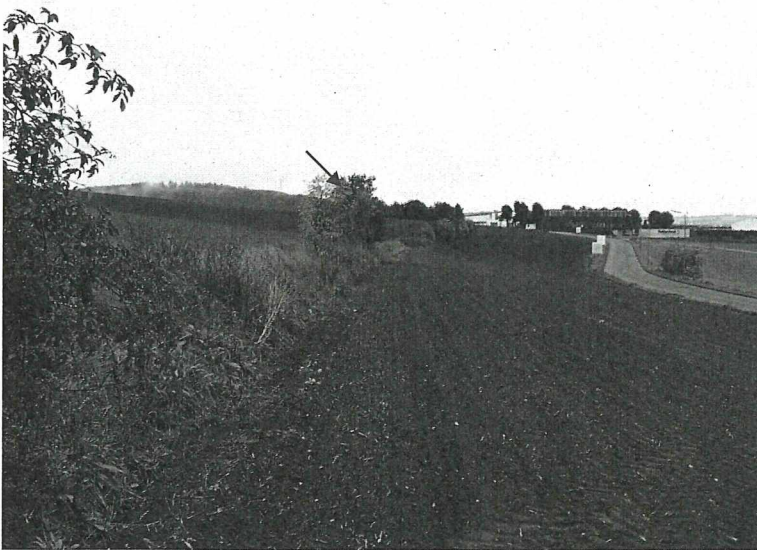
Abbildung 4: Gehölzriegel im Ackerbereich mit Neststandort