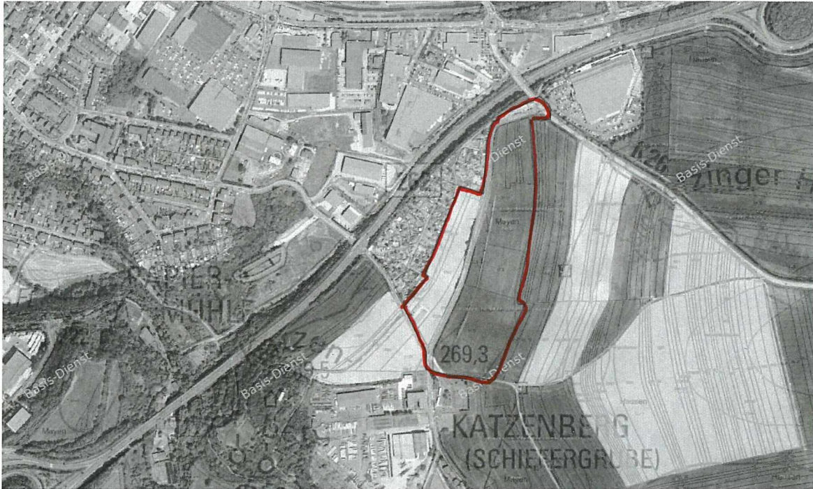
Abbildung 1: Lage des Plangebietes im Raum

Auf der Grundlage des Bebauungsplanverfahrens wird eine artenschutzrechtliche Potentialanalyse zur möglichen Beeinträchtigung besonders und streng geschützter Arten erstellt, die hiermit vorgelegt wird.