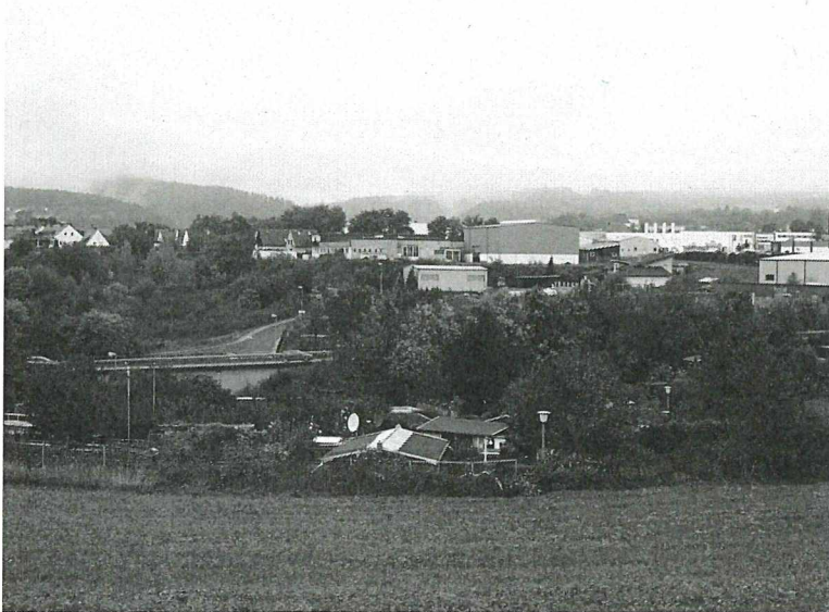
Abbildung 7: Blick über die Greening-Fläche mit anschließender Laubenkolonie