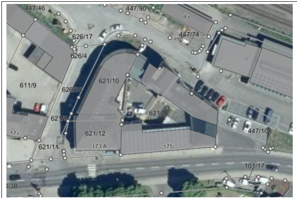
Abb.1: Lage des Plangebietes (Auszug aus LANIS-RLP), unmaßstäblich

Topographisch gesehen fällt der Änderungsbereich leicht zur „Koblenzer Straße“ hin ab.