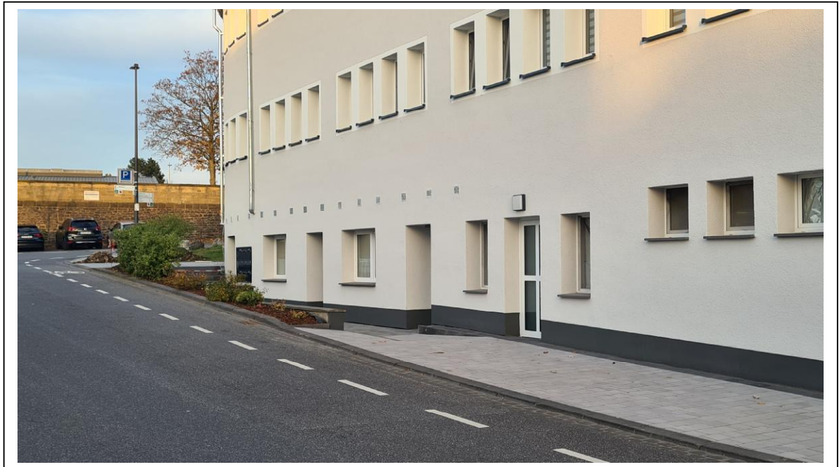
Abb. 3: Bestehende Situation mit vier Hauseingängen

Auf diese wird im vorliegenden Fall verzichtet. Der künftig zu nutzende Bereich ist bereits fast vollständig versiegelt und beinhaltet Hauseingang und Zuwegung des Gebäudes.