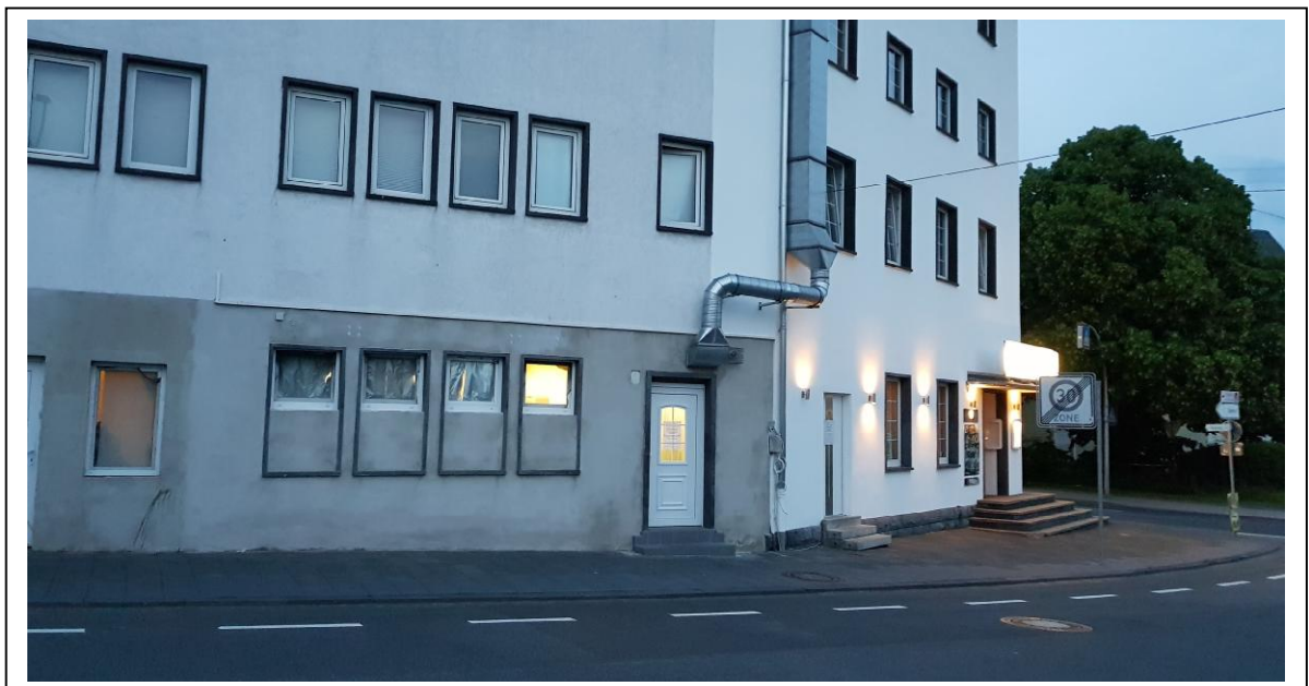
Abb. 4: Bestehende Situation Gastronomiebereich