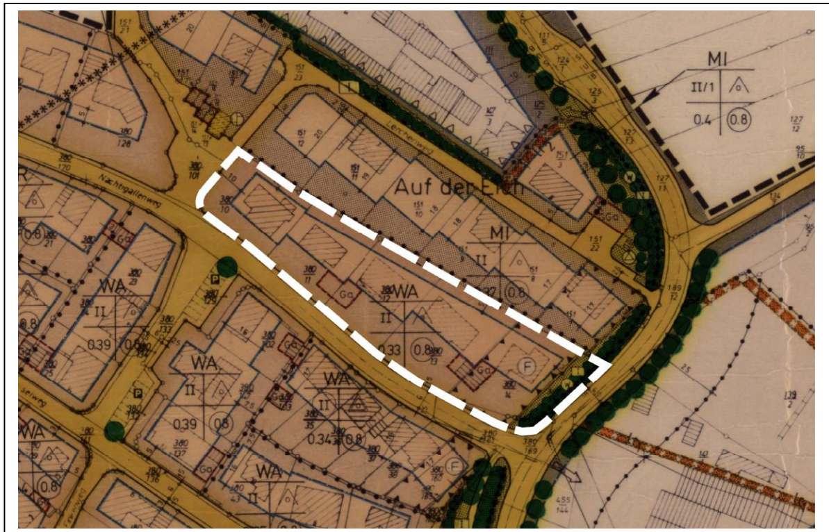
Abb. 2: Rechtskräftiger Bebauungsplan „Im Vogelsang“ mit Markierung des Bereichs der 13. Änderung - unmaßstäblich

Im östlichen Teil des Geltungsbereichs befindet sich eine öffentliche Grünfläche mit Festsetzungen zur Lärminderung (Erdwall und Schutzpflanzungen).