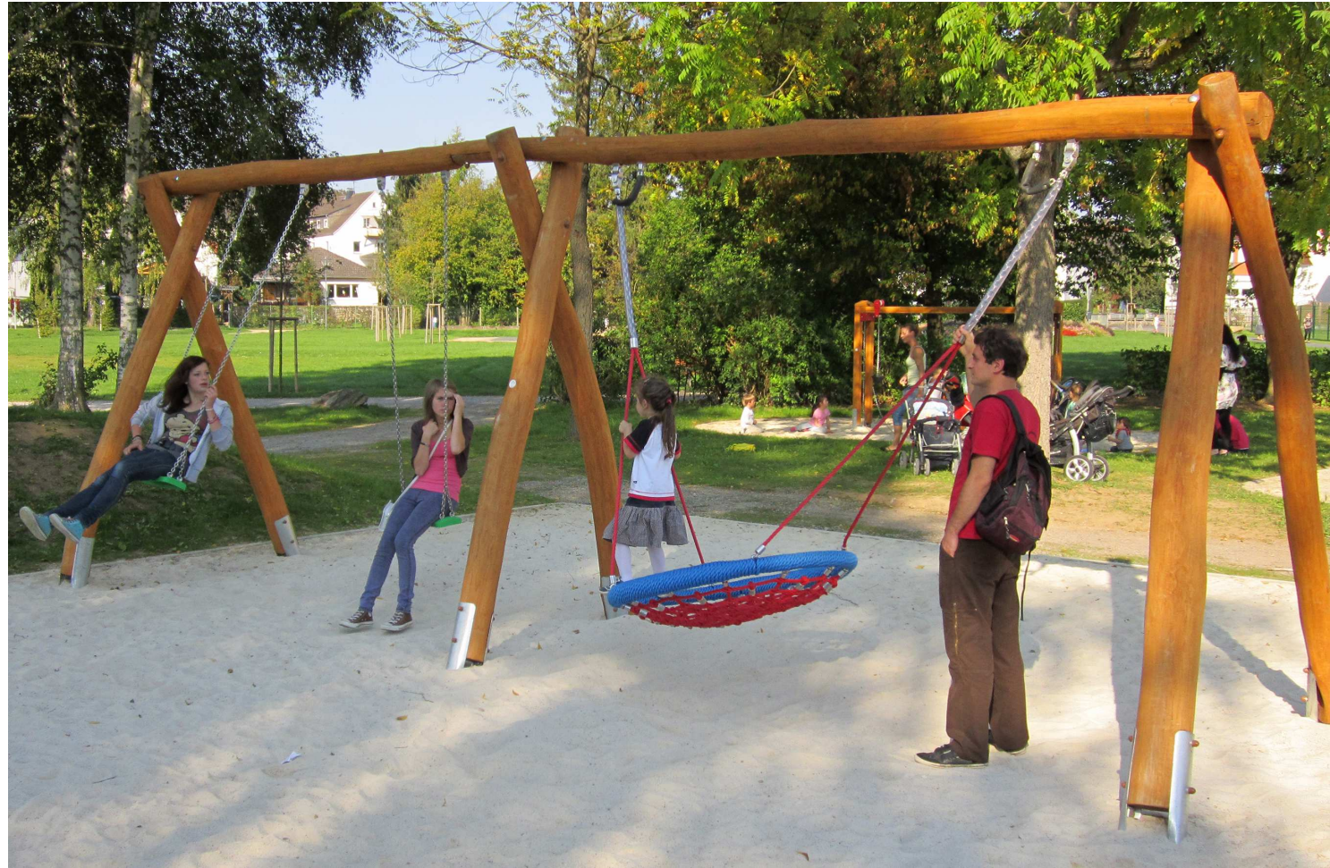
Abbildung Nest - Doppelschaukel mit Pfostenschuhe, Ausführung jedoch gemäß Angebot OHNE Pfostenschuhe!