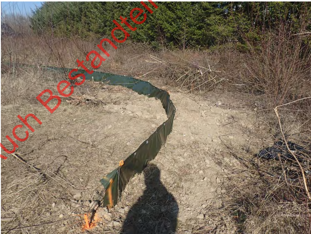
Bild 06: Gestellter Fangzaun (10.03.2022)