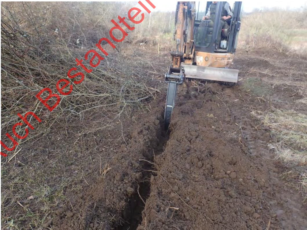
Bild 13: Ziehen einer Furche zum Einlassen der Rhizomsperre (02.02.2022)