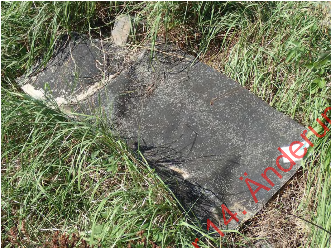
Bild 07: Ausgelegte Dachpappe zum Abfangen der Schlingnattern (19.04.2022)