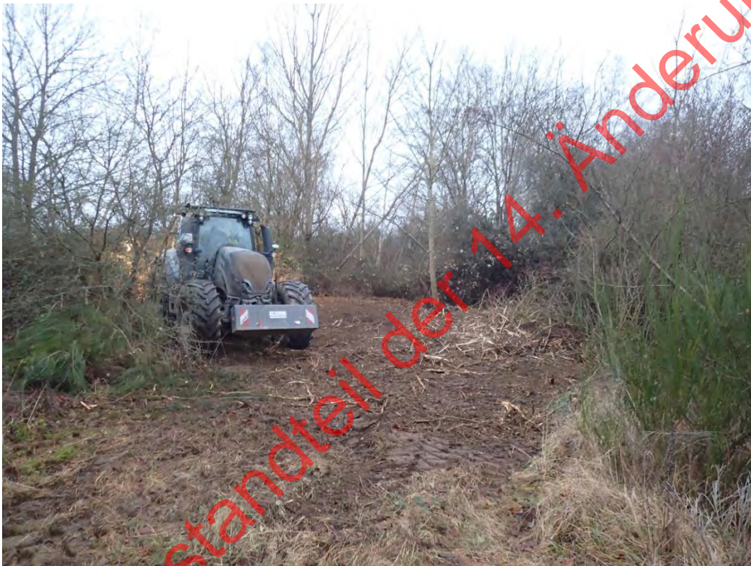
Bild 09: Gehölzbeseitigung mittels Forstmulcher (20.12.2022)

Während der Fangperiode wurden wöchentlich alle Zäune durch die Umweltbaubegleitung auf ihre Unversehrtheit geprüft und eventuelle Beschädigungen umgehend repariert.