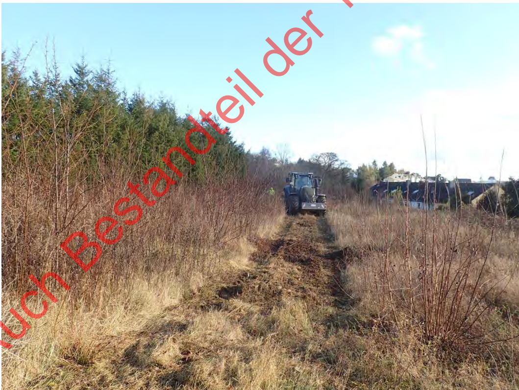
Bild 03: Rodung der zuvor entsprechend markierten Gehölzbestände im Eingriffsbereich (20.12.2021)

Insgesamt wurden 60 Einzelfallen in dem Vorhabensgebiet vergraben oder entsprechend aufgestellt, so dass zusätzlich zum durchgeführten Schlingenfang auch Tiere über die Fallen aus der Fläche entfernt werden konnten. Die Fallen waren dabei immer nur fängig (aktiv geschaltet), wenn geschultes Personal vor Ort war. Aufgrund der Topographie und der Fangergebnisse wurde auf das Ausbringen weiterer Fallen vorerst verzichtet.