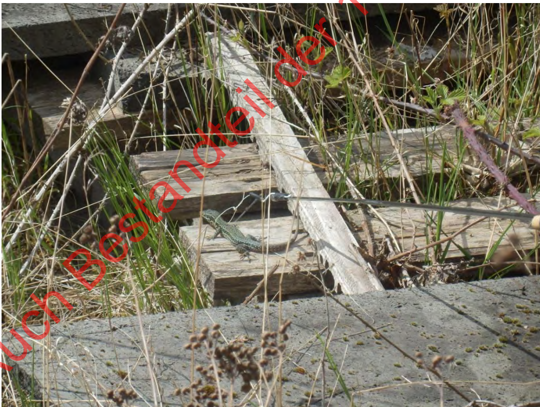
Bild 18: Mauereidechsenmännchen während des Abfangens mit Schlinge um den Hals