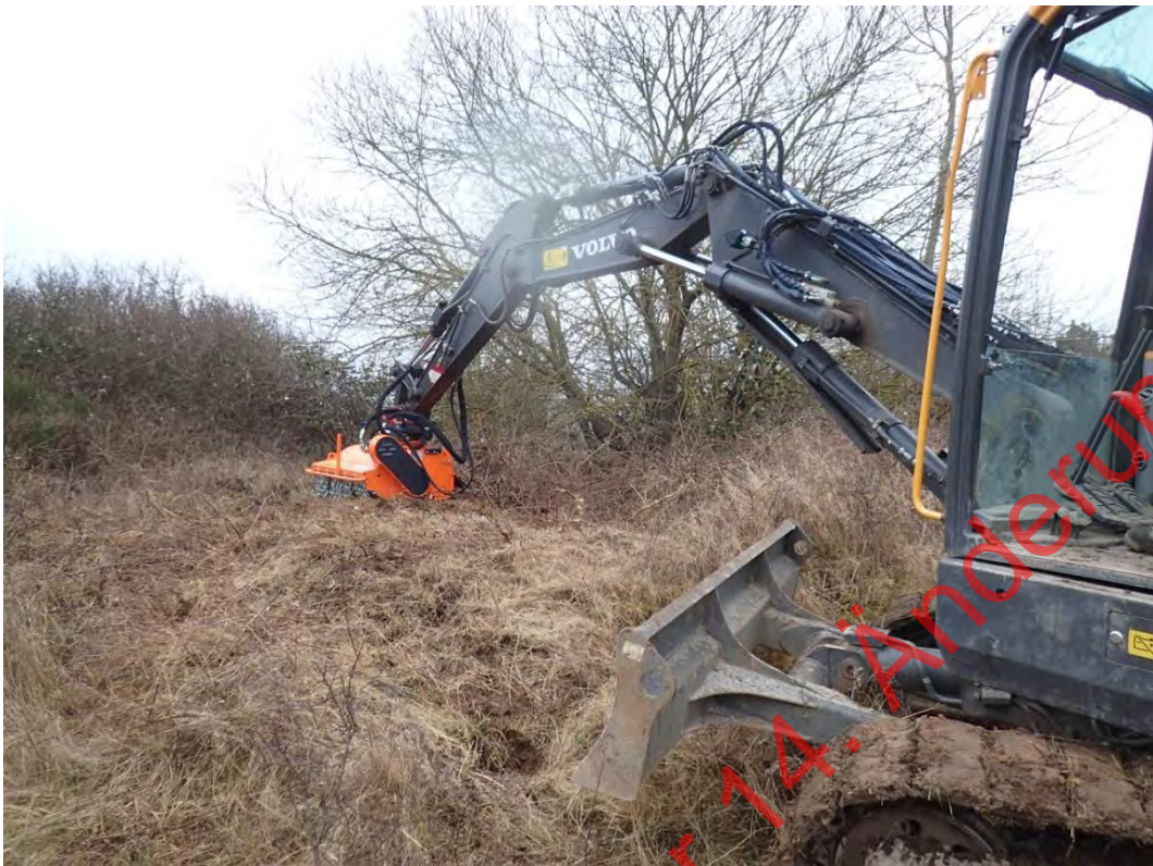
Bild 10: Zusätzliche Freistellungen mittels Mulchkopf am Bagger in schwer zugänglichen Bereichen