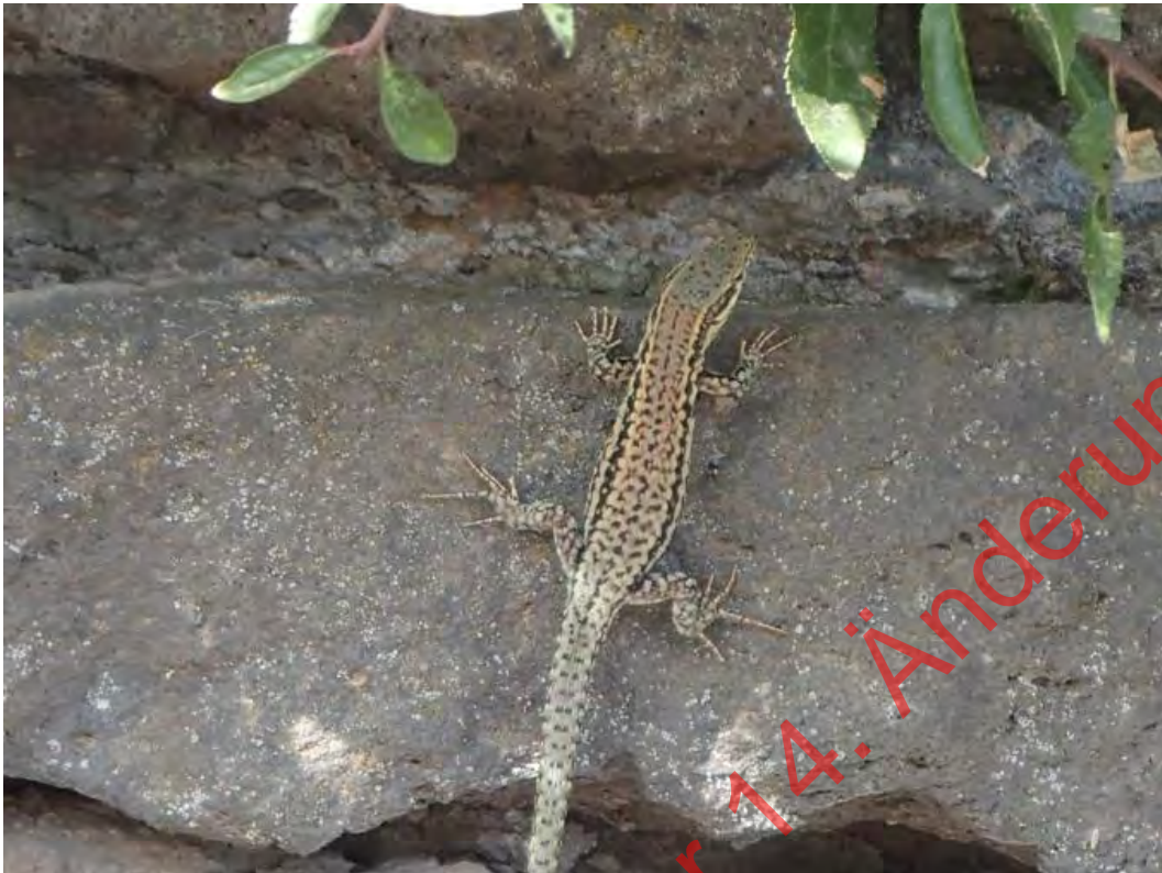
Bild 02: Männliche Mauereidechse an einer Trockenmauer bei SHS Naturstein GmbH

Der Artenschutzrechtliche Fachbeitrag (VIRIDITAS 2021) beschreibt, dass ohne Maßnahmen zur Sicherung der kontinuierlichen ökologischen Funktionalität ('CEF') des Lebensraumes der nachgewiesenen Mauereidechsenpopulationen sowie zur Vermeidung vermeidbarer Beeinträchtigungen der betroffenen Individuen und ihrer Entwicklungsformen die vorliegende Planung gegen die artenschutzrechtlichen Bestimmungen des § 44 Abs. 1 BNatSchG verstößt.