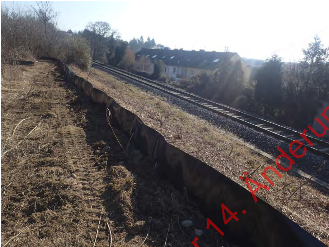
Bild 05: Abzäunung des Eingriffsgebiets (10.03.2022)