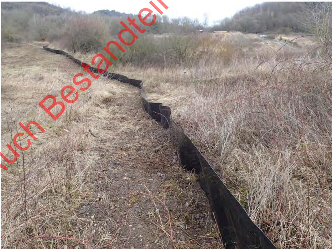
Bild 17: Fertig gestellte Rhizomsperr auf dem Deponiegelände (24.02.2022)