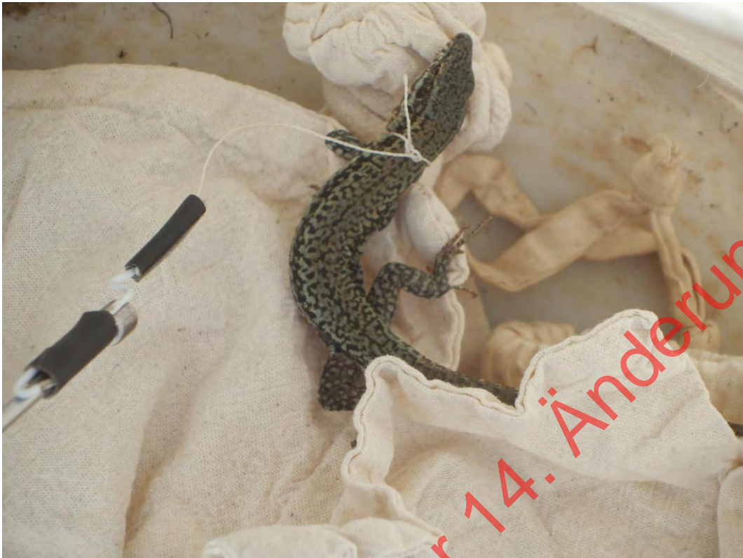
Bild 19: Das gefangene Männchen wird im Eimer von der Schlinge befreit