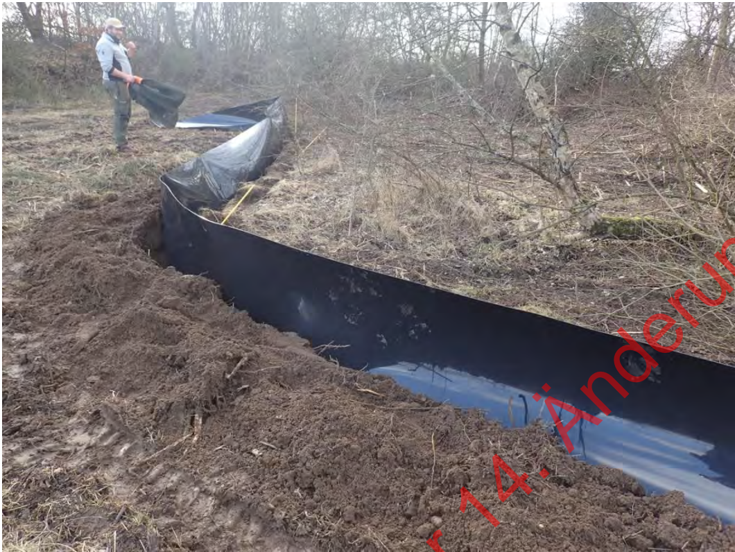
Bild 14: Einsetzen der Rhizomsperre (02.02.2022)