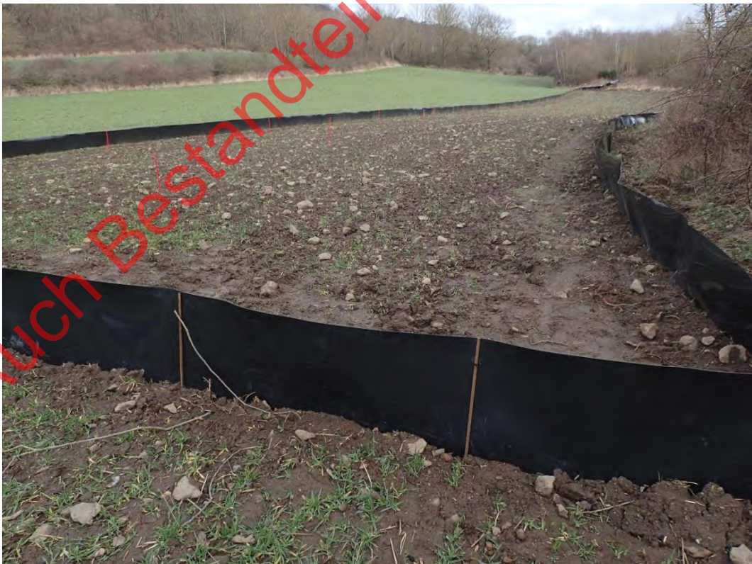
Bild 15: Fertig gestellte Rhizomsperre auf der Ackerfläche (24.02.2022)