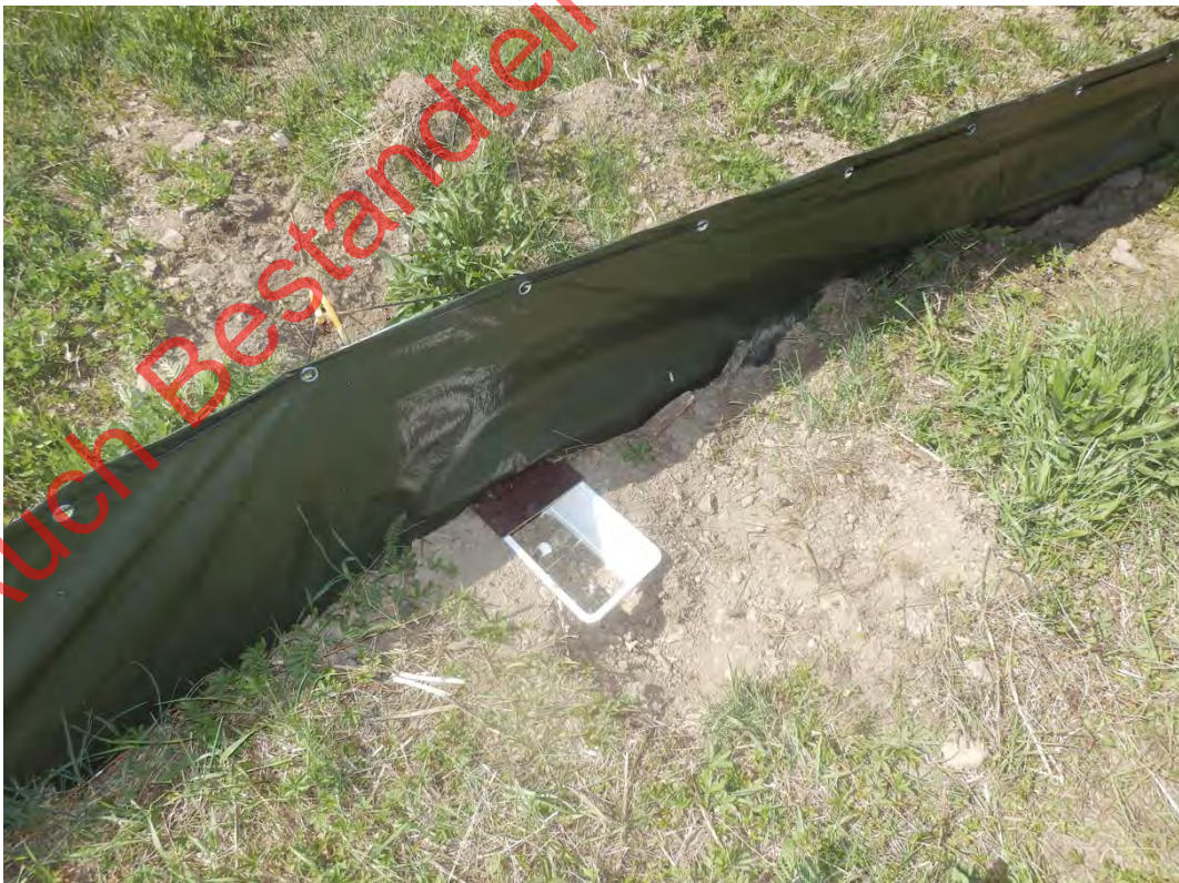
Bild 08: Eingebaute Eidechsenfalle (19.04.2022)