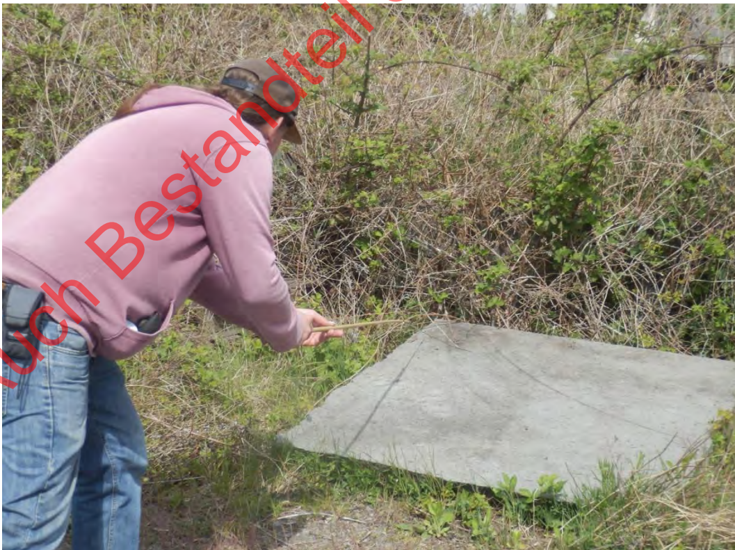
Bild 22: Dipl.-Biol. Ralf Thiele beim Schlingenfang einer Mauereidechse