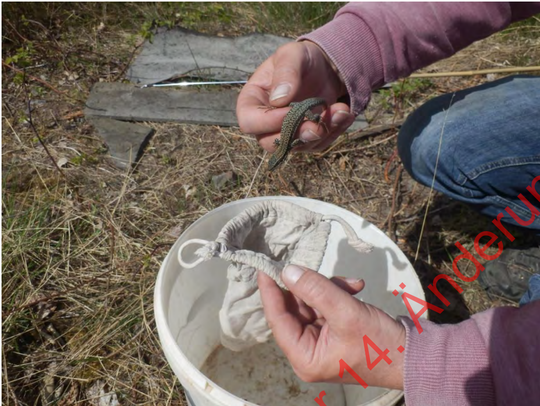
Bild 21: Verwahrung des gefangenen Tiers in einem Baumwollsäckchen bis zur Aussetzung