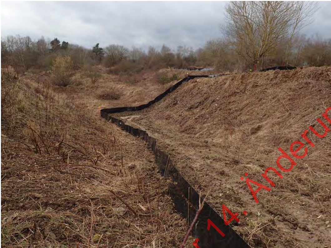
Bild 16: Fertig gestellte Rhizomsperr im Grubenbereich (24.02.2022)