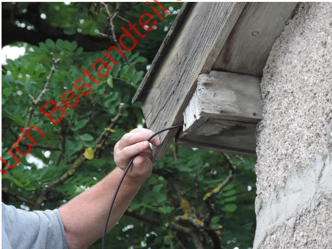
Bild 32: Um in kleinste Spalten schauen zu können wurde eine Endoskopkamera verwendet