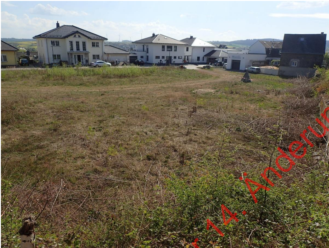
Bild 13: Die südwestliche Fläche besitzt keine Habitateignung für Vögel und Fledermäuse