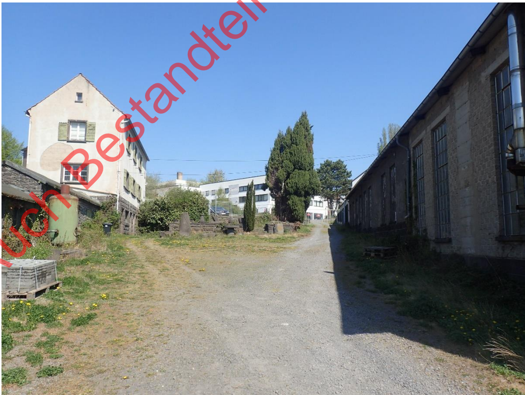
Bild 16: Die südöstliche Fläche weist zahlreiche Quartiermöglichkeiten auf