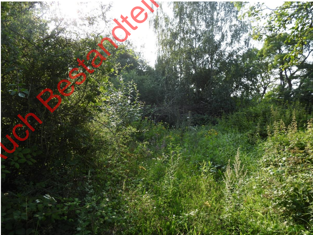
Bild 26: Der östliche Teil der Fläche ist komplett verbuscht und schwer zugänglich