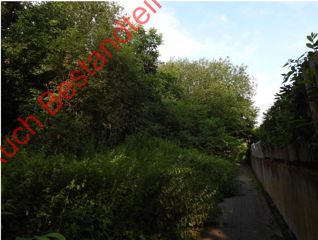
Bild 28: Blick auf den südöstlichen Gehölzbestand vom begleitenden Fußgängerweg aus