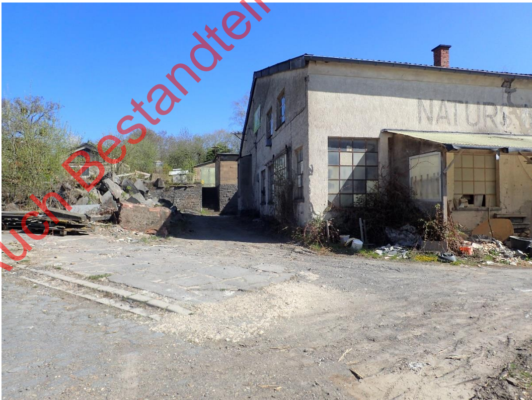
Bild 06: Die Gewerbeflächen bieten eine Vielzahl potenzieller Quartiere für Gebäudebrüter