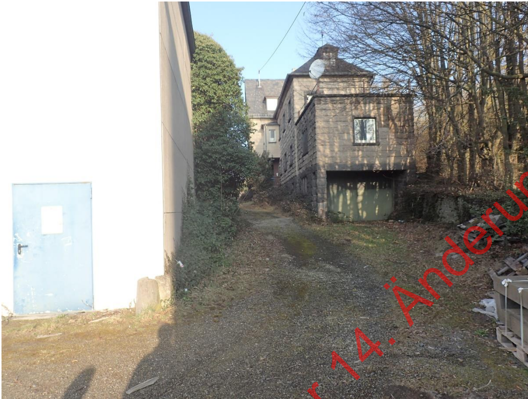
Bild 09. Blick auf die kleinen Wohnhäuser neben den gewerblichen Gebäuden