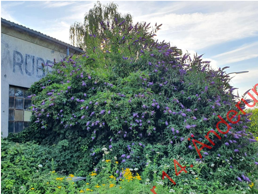
Bild 03: Der große Schmetterlingsflieder, an dem die Große Hufeisennase Nahrung sucht