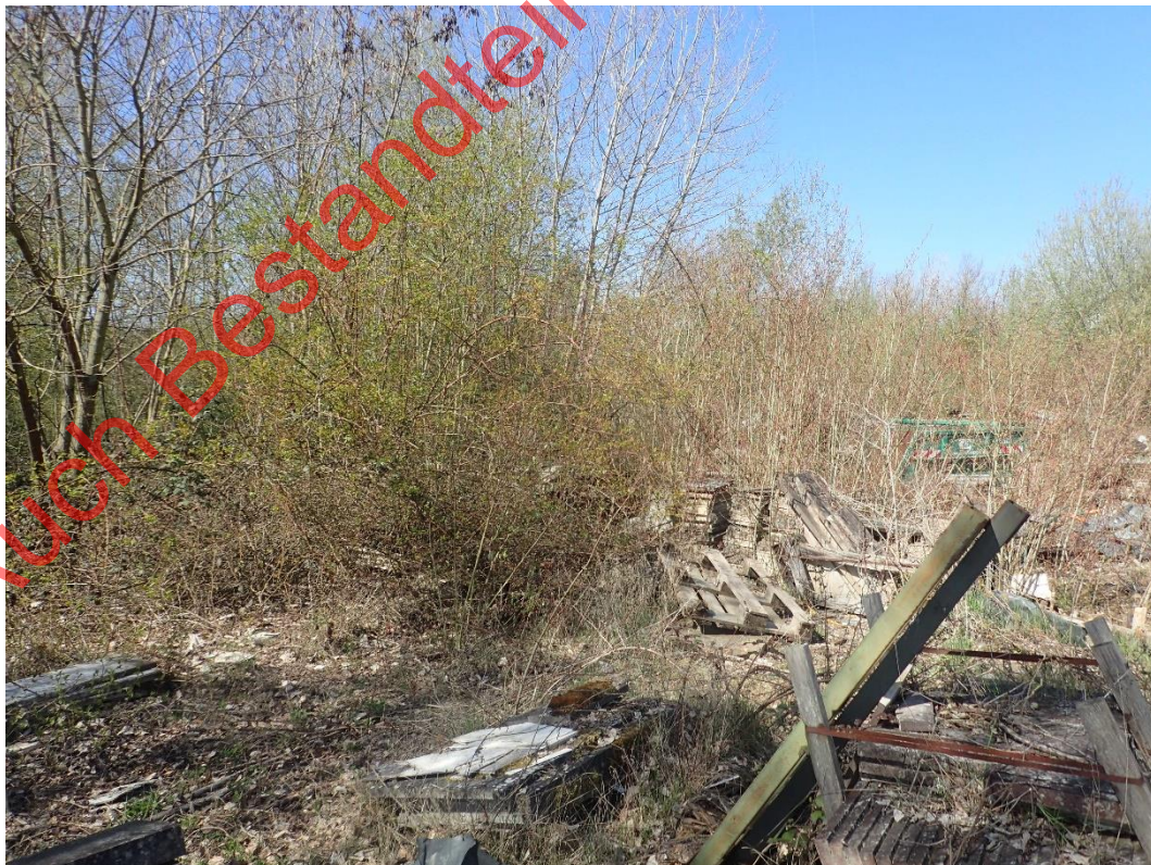
Bild 04: Lagerflächen mit Gehölzaufwuchs bilden Habitate für Gebäudebrüter