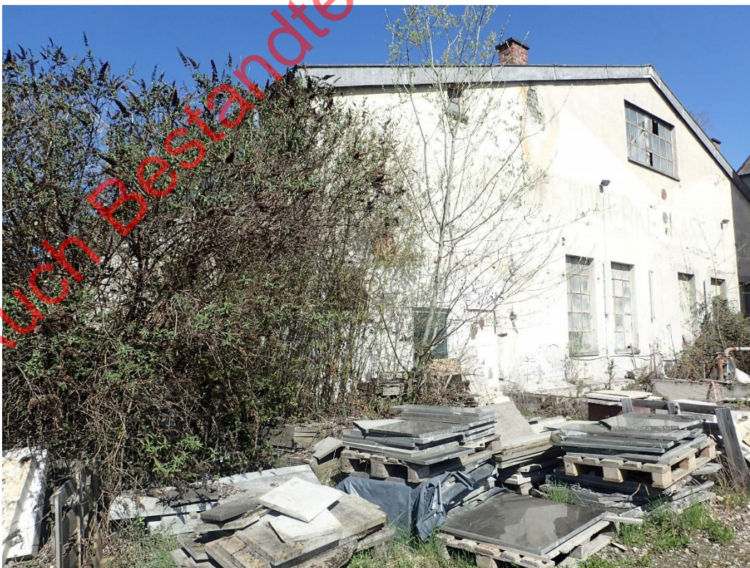
Bild 02: Das abzureißende Gebäude im nördlichen Gebäude mit Schmetterlingsflieder