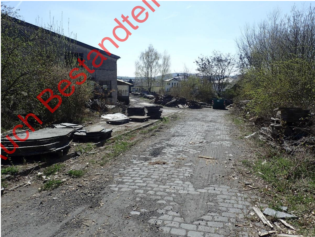
Bild 08: Nördliche Zufahrt auf das Betriebsgelände mit randlich gelegenen Gehölzen