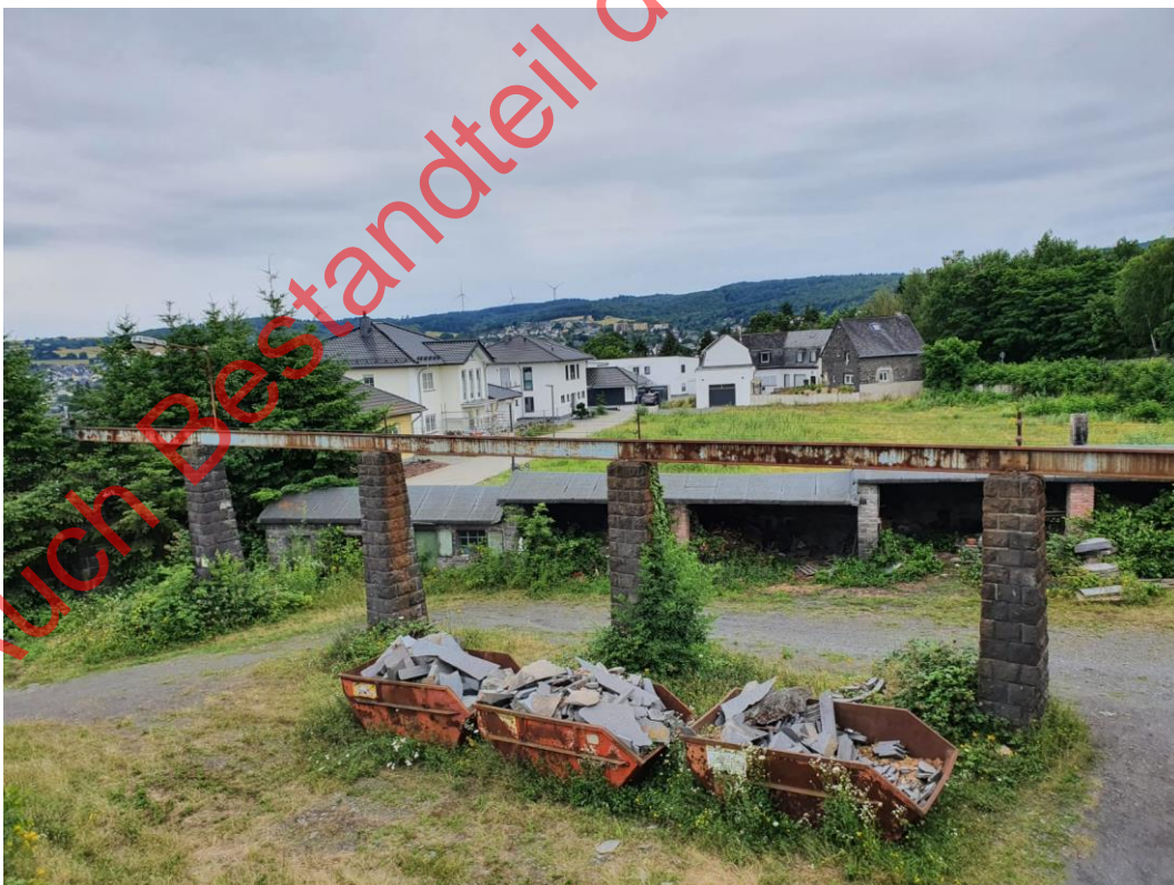
Bild 18: Die alten Schienen des Krans bieten den Vögeln gute Anblicksmöglichkeiten (vom Hubsteiger aus)