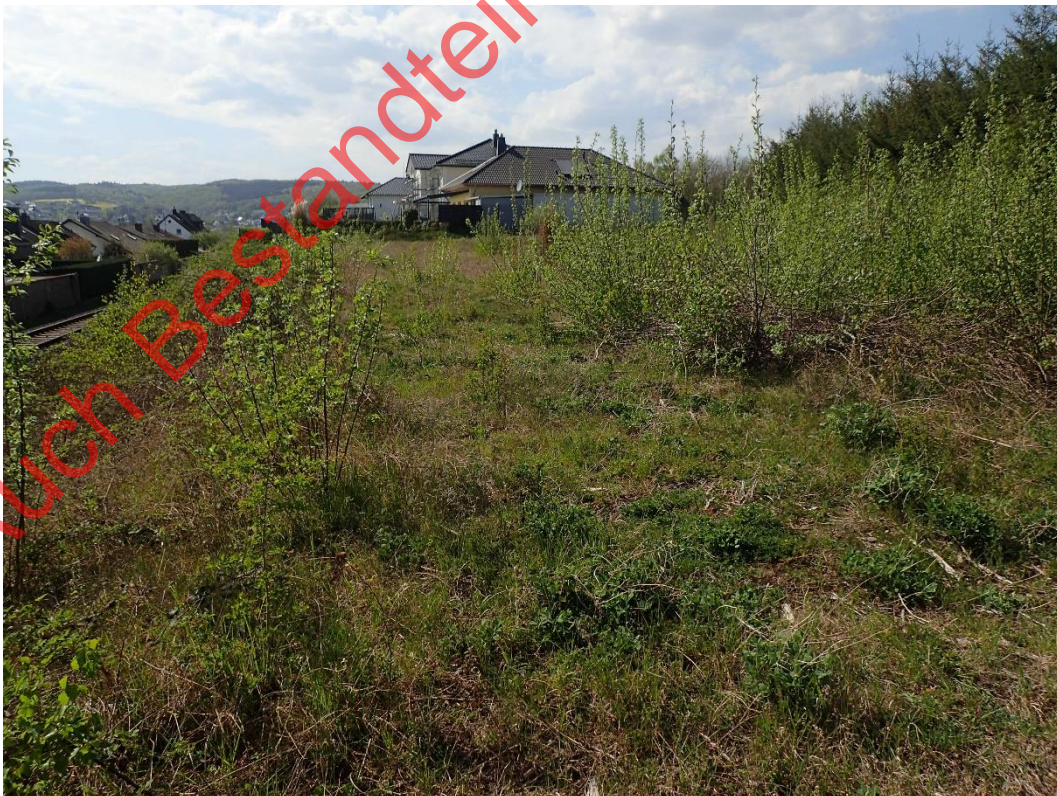
Bild 14: Die rückgebaute Gewerbefläche an der Bahnlinie besitzt Habitatpotenzial für Vogelarten des Halboffenlandes