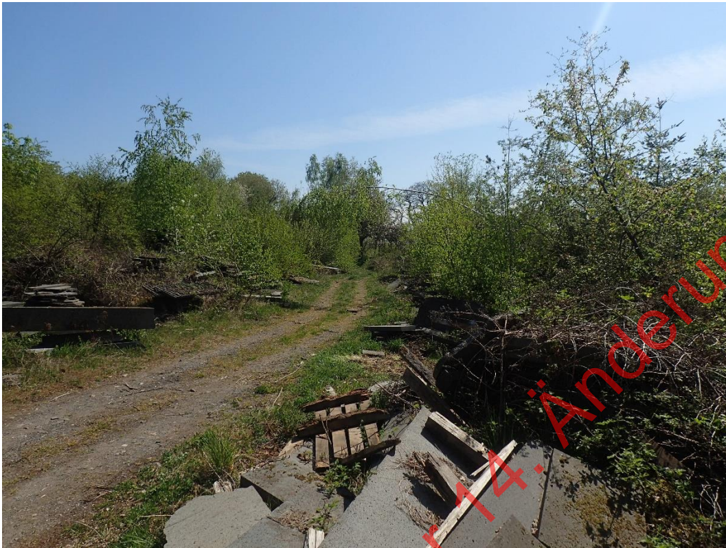
Bild 25: Blick auf den östlichen Teil des südöstlichen Betriebsgeländes