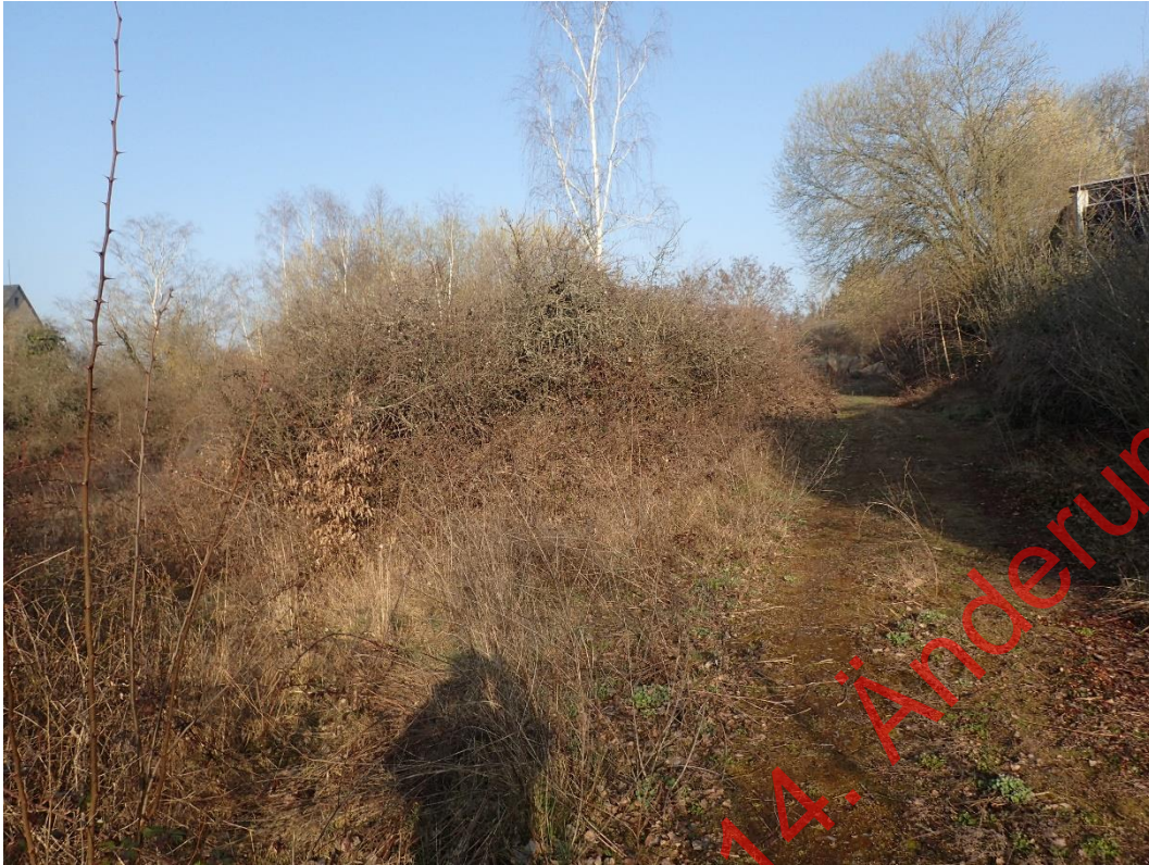
Bild 11: Die nordöstliche Fläche bildet ein störungsarmes Gebiet für Halboffenland-Besiedler