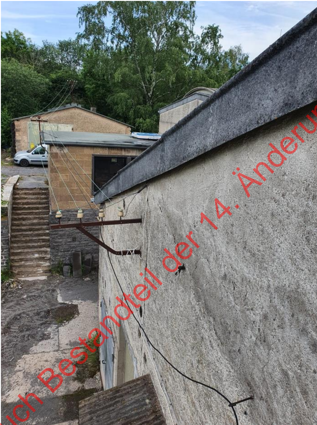
Bild 33: Mittels Hubsteiger konnten die meisten potenziellen Fledermausquartiere gezielt auf eine tatsächliche Nutzung überprüft werden