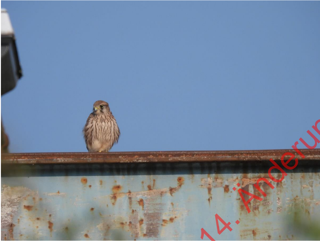
Bild 19: Turmfalken nutzen die Schienen, um potenzielle Beute zu erspähen