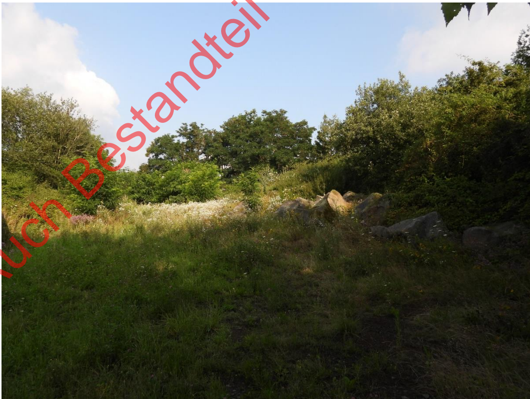
Bild 12: Auch die nordöstliche Fläche ist randlich von dichten Gehölzen umgeben