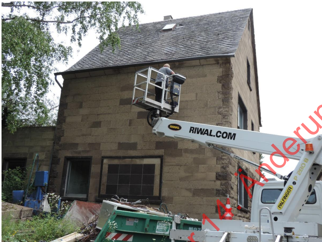
Bild 31: Mit einem Hubsteiger wurden alle Gebäude nach Fledermausquartieren abgesucht