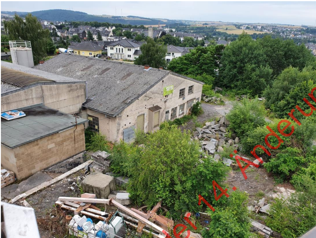
Bild 01: Blick auf den nördlich gelegenen Gebäudekomplex vom Hubsteiger