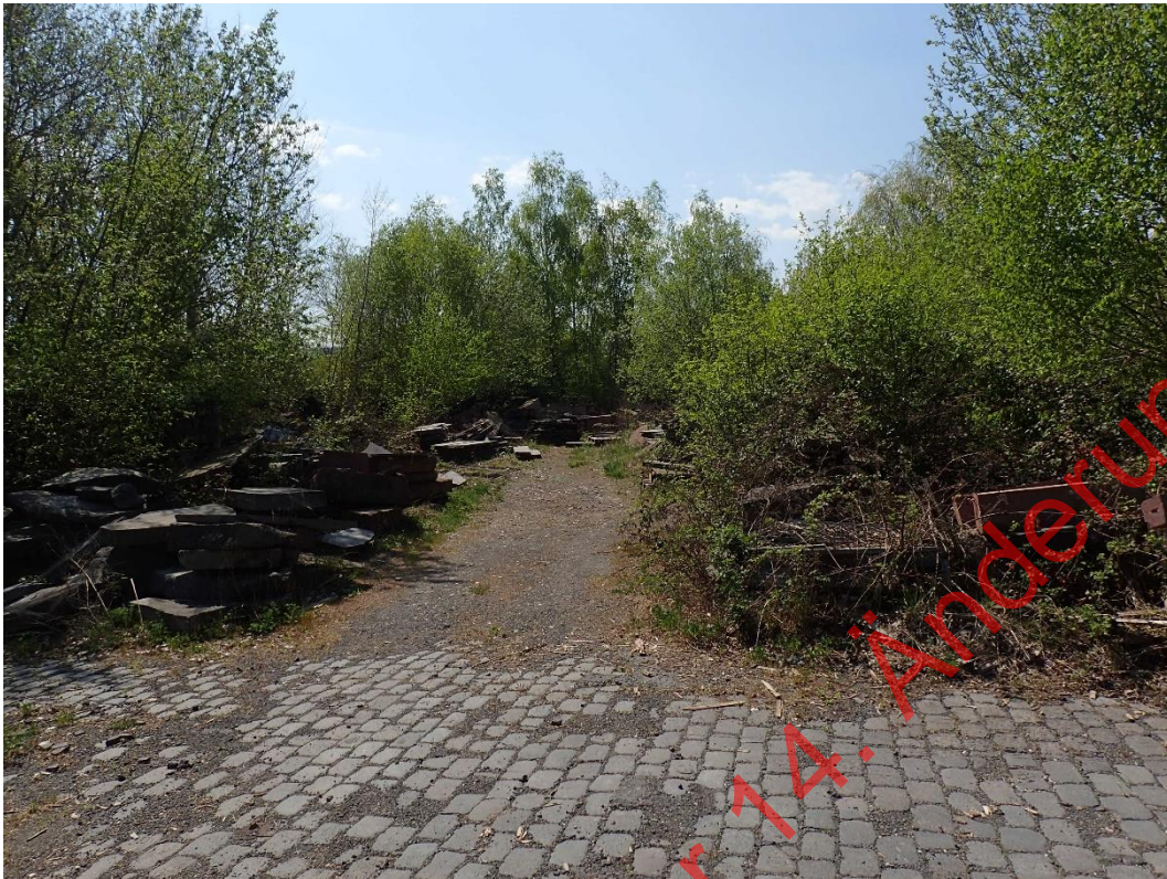
Bild 05: In Randbereichen der Lagerflächen sind Vorwälder entwickelt