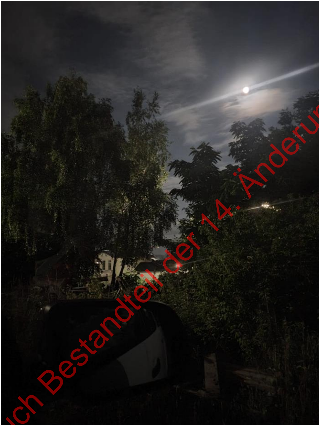
Bild 34: In der letzten Juliwoche 2021 boten sich erstmals im Jahr günstige Bedingungen für nächtliche Fledermauskontrollen