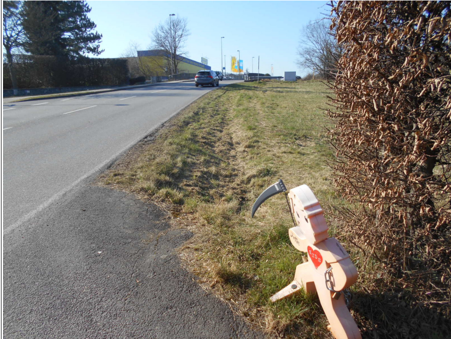
Bild 5 (Zufahrt Haus Nr. 5, Blickrichtung FR Mayen/Bauende an Brückenbauwerk)