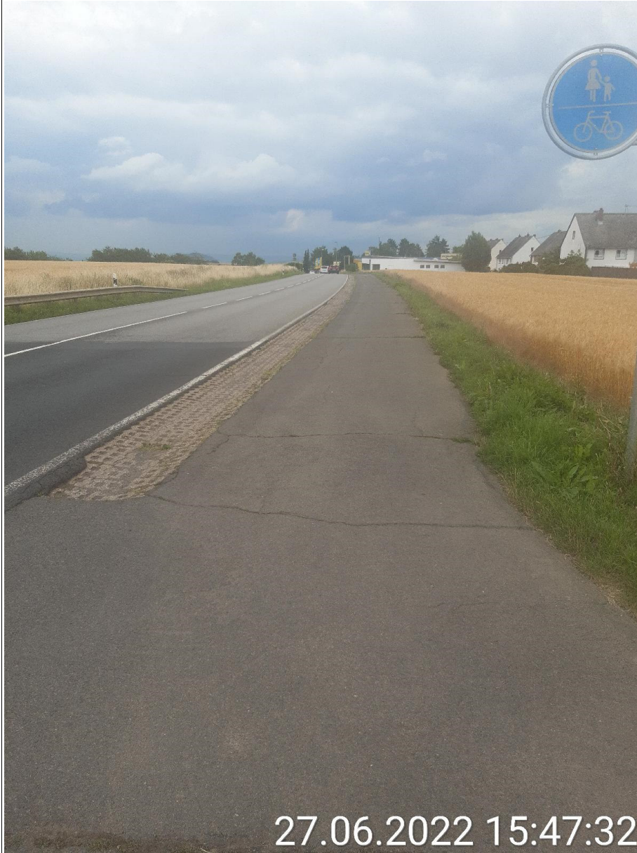
Bild 5 (Beginn gemeinsamer Rad- und Gehweg entlang L98 / Hausener Landstraße)