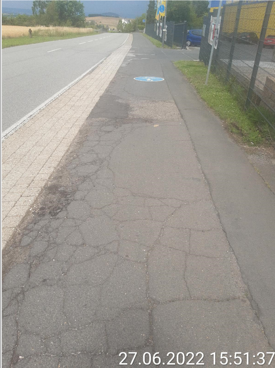
Bild 7 (Defekter Asphalt des gemeinsamen Rad- und Gehweg entlang L98 / Hausener Landstraße)