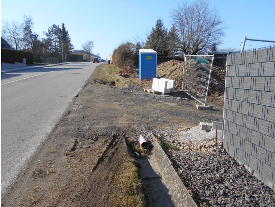
Bild 3 (Zufahrt Neubau oberhalb Haus Nr. 7, Blickrichtung FR Mayen)