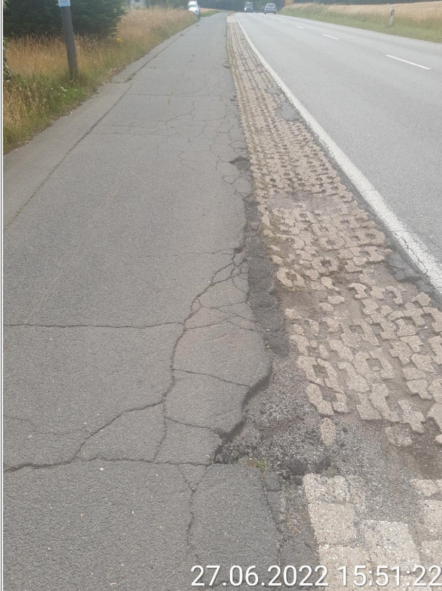
Bild 6 (Defekte Rinnenanlage und Asphalt des gemeinsamen Rad- und Gehweg entlang L98 / Hausener Landstraße)