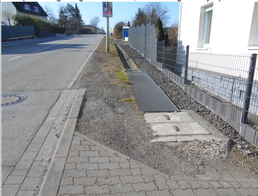
Bild 2 (Ende des Bestands bei Haus Nr. 7, Blickrichtung FR Mayen)