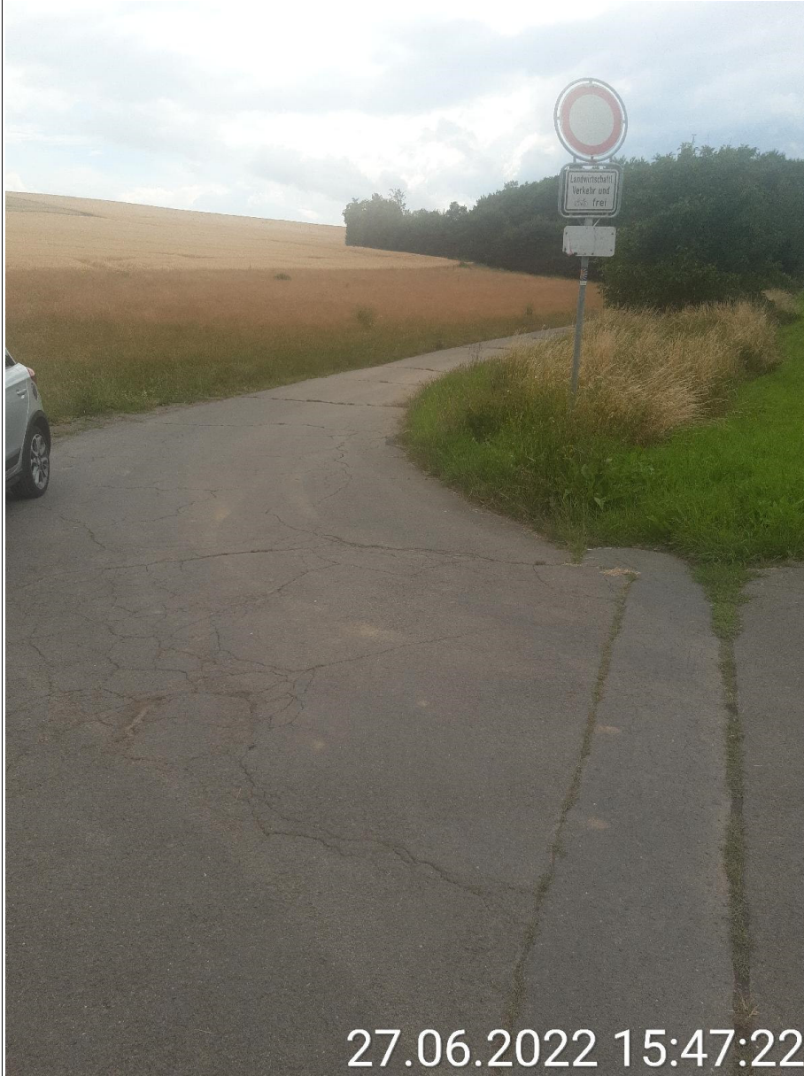
Bild 4 (Radwegführung auf landwirtschaftlichem Weg Übergang zum straßenbegleitenden 2. BA)