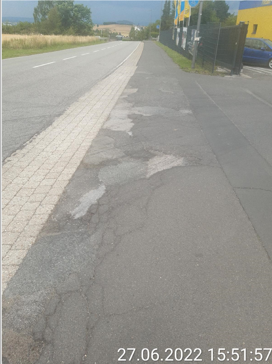
Bild 8 (Defekter Asphalt des gemeinsamen Rad- und Gehweg entlang L98 / Hausener Landstraße)