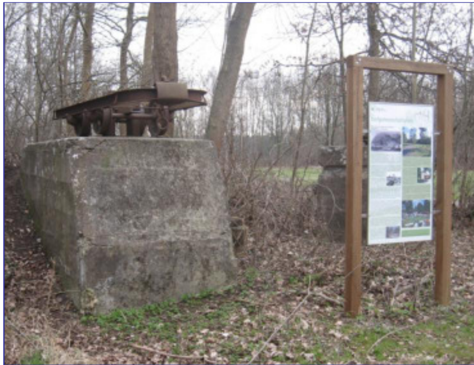
An 5 Standorten