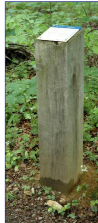
An allen sonstigen Standorten