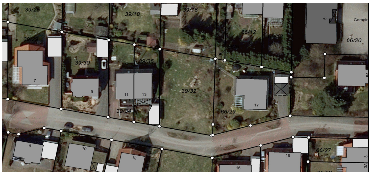
Abbildung 3: Luftbild des Grundstückes