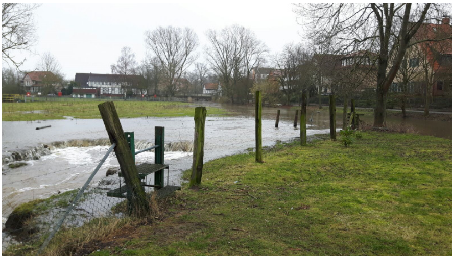
OR Neustadt a. Rbge., 01.03.2017 – Wasserrecht Ecksteinmühle