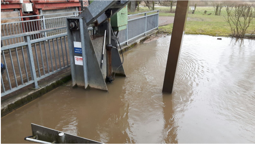
OR Neustadt a. Rbge., 01.03.2017 – Wasserrecht Ecksteinmühle