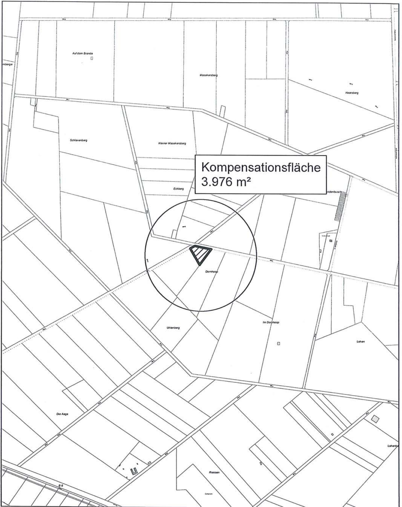
Lageplan der Ersatzmaßnahme für den Eingriff in die Natur und Landschaft für den Bebauungsplan Nr. 373 "Im Dahle - 1. Bauabschnitt" – Eilvese