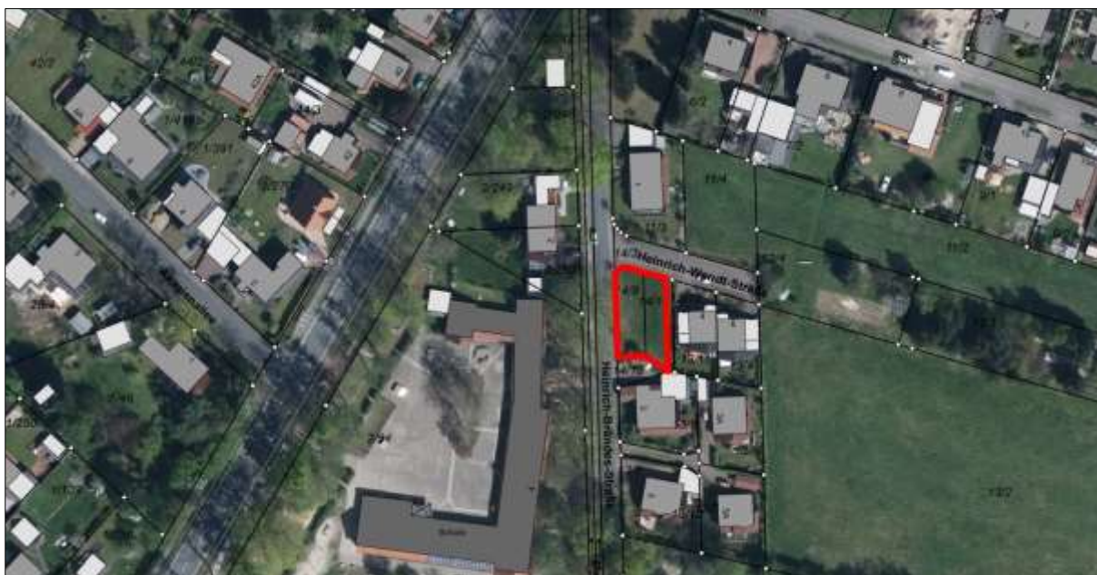
Abbildung 3: Luftbild des Plangebietes