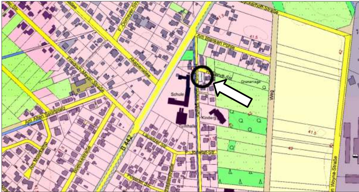
Abbildung 1: Lage des Plangebietes