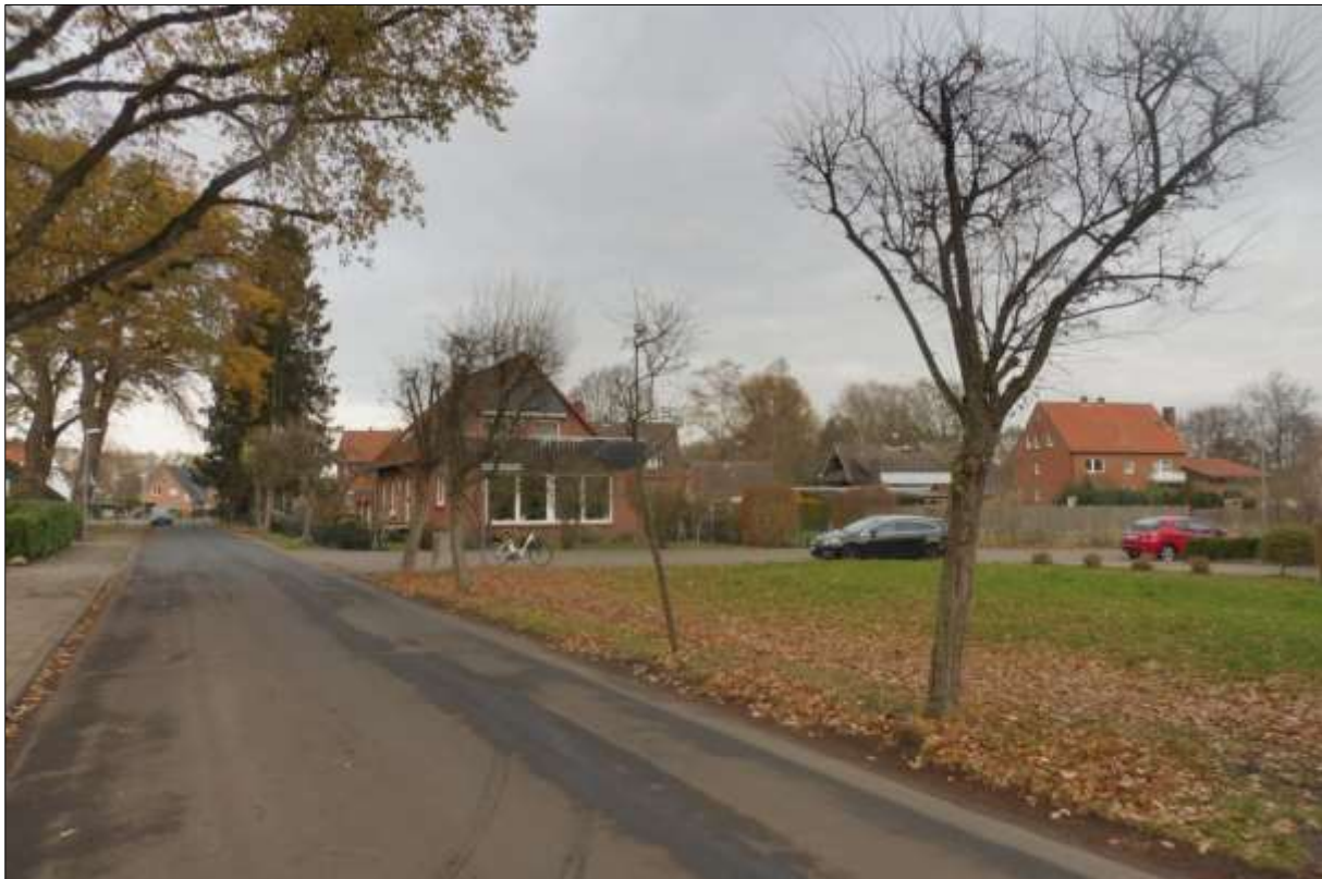
Abbildung 3: Foto des Schulgartengrundstücks

Bei der Kennzeichnung der Biotoptypen und der Ermittlung des Kompensationsbedarfs orientiert sich die Stadt an der Arbeitshilfe für die Bauleitplanung „Numerische Bewertung von Biotoptypen für die Bauleitplanung in NRW“ (LANUV 2008). Auf eine Darstellung der Biotoptypenkartierung wurde wegen der Simplizität der Darstellung verzichtet.