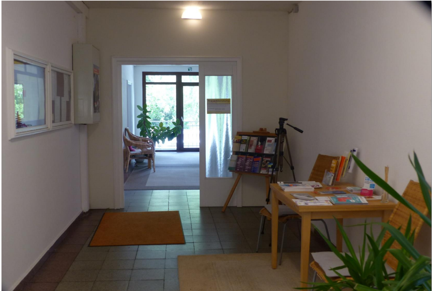
Flur im Eingangsbereich