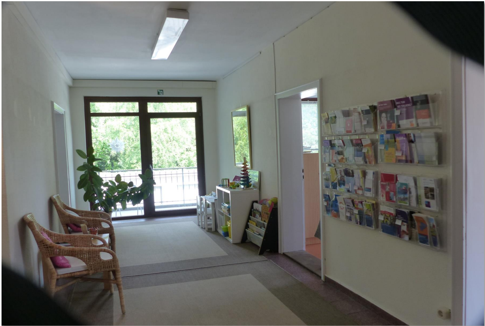
Wartebereich mit Spielecke