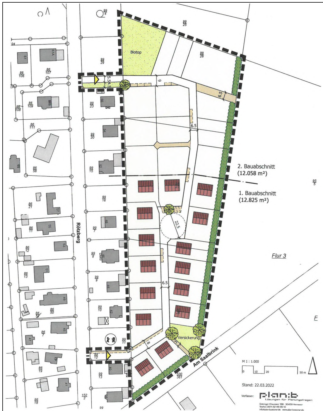
Städtebauliches Konzept (Entwurf im Maßstab M 1 : 1.000, unmaßstäblich verkleinert)

Zur Vorbereitung der Bebauungsplanung hat die Stadt Neustadt a. Rbge. in Abstimmung mit dem Erschließungsträger einen städtebaulichen Entwurf für die Entwicklung des Plangebiets erarbeitet. Dieses nachstehend abgebildete Konzept stellt die mögliche Parzellierung und Gestaltung des Plangebiets exemplarisch dar und bildet die Basis der in Kapitel 5 begründeten städtebaurechtlichen Festsetzungen des Bebauungsplans.