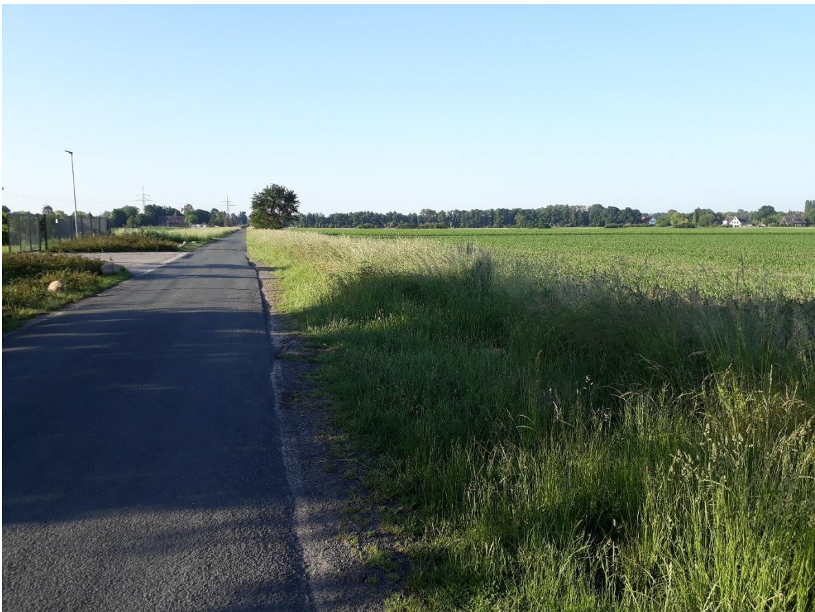
Abbildung 2-8: Bereich längs der Hans-Böckler-Straße, der im Jahr 2022 nachuntersucht wurde (10.06.2022)