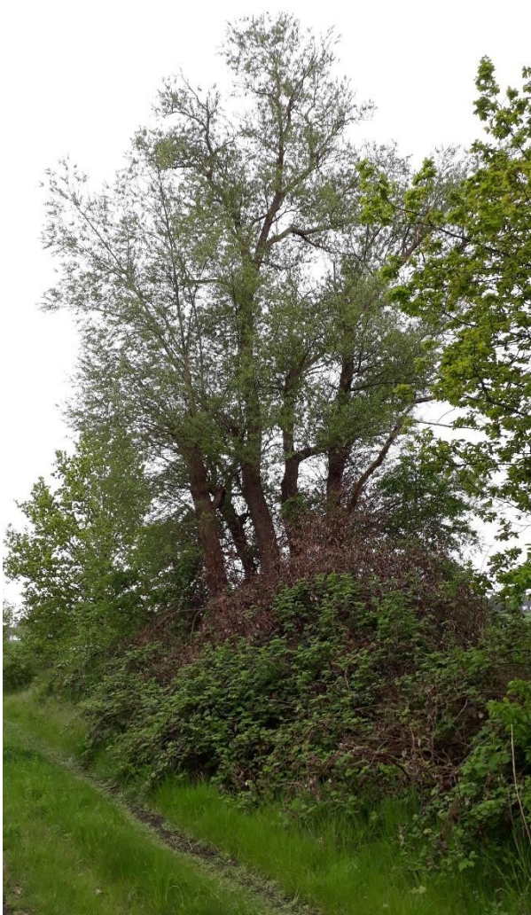
Abbildung 2-4: Ausschnitt der Gehölzreihe westlich der Bahn (18.05.2021)