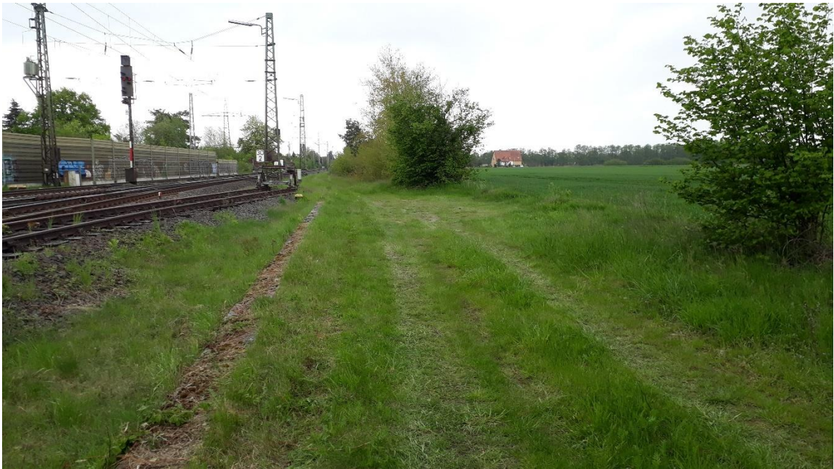
Abbildung 2-3: Blick längs der Bahnstrecke in Richtung Süden (18.05.2021)