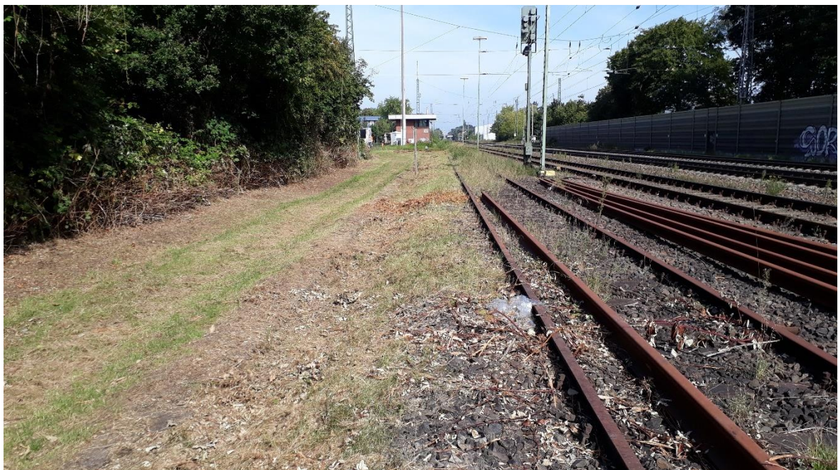
Abbildung 2-2: Blick längs der Bahn Richtung Nord; im Hintergrund der Bahnübergang Siemensstraße (06.09.2021)