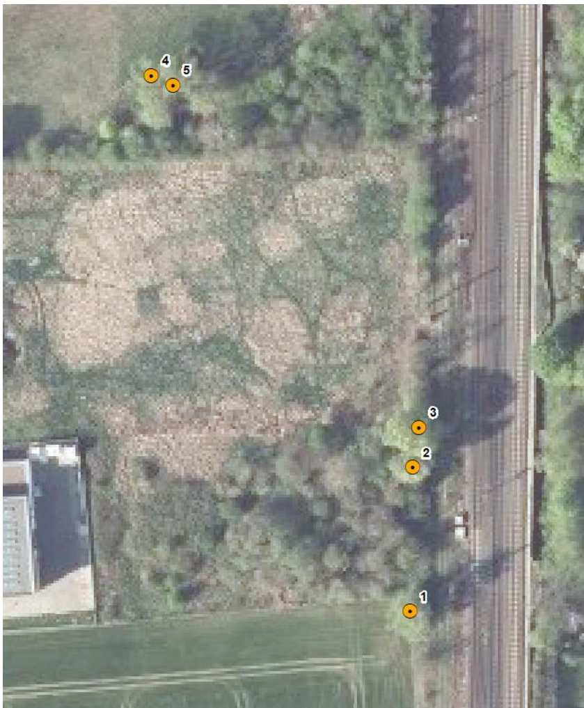
Abbildung 4-1: Lage der Habitatbäume.