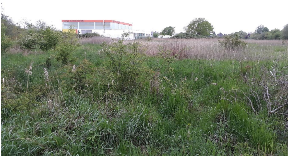
Abbildung 2-6: Brachfläche zwischen Bahn und Gelände der Firma Temps (18.05.2021)