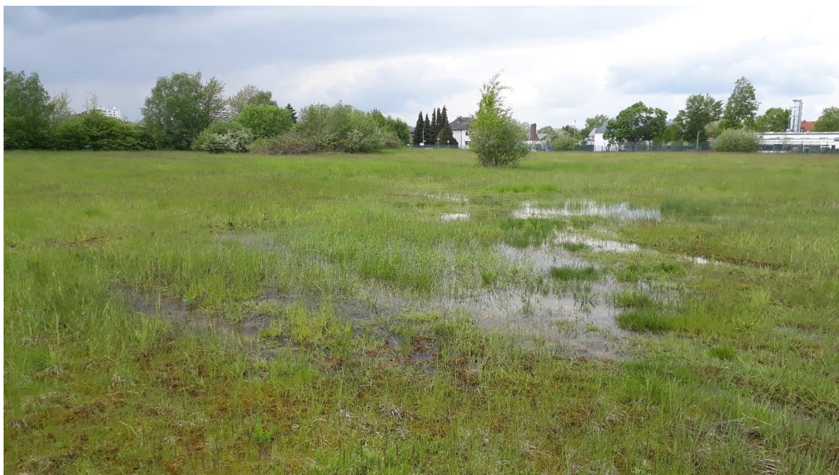
Abbildung 2-5: Grünlandfläche mit Tümpel im Nordwesten („Rentrop-Fläche“; 18.05.2021)