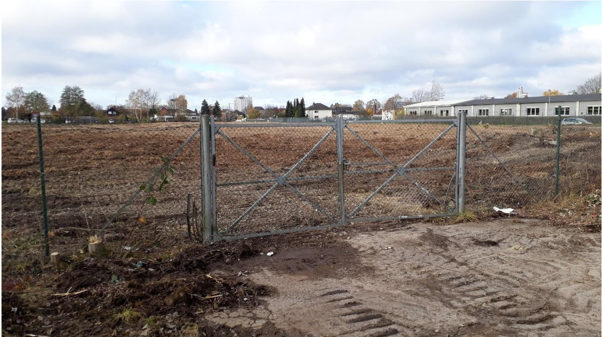
Abbildung 2-7: Im Nordwesten des Untersuchungsgebietes wurden nach Ende der Erfassung Gehölze gerodet und der Oberboden planiert (12.11.2021)