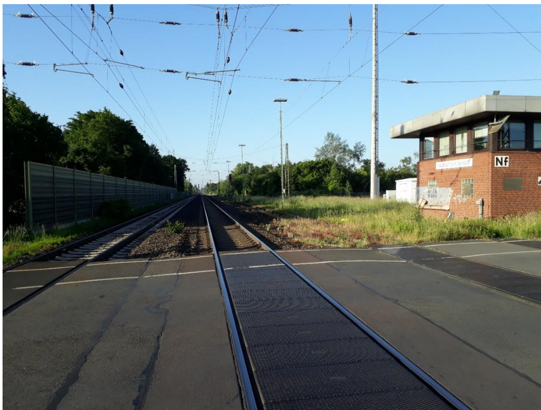
Abbildung 4-2: Bahnübergang Siemensstraße und Blick längs der Bahnstrecke nach Süden (10.06.2022)