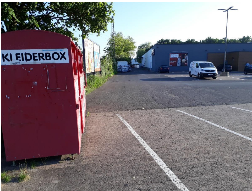
Abbildung 4-3: Supermarktparkplatz östlich der Gleise