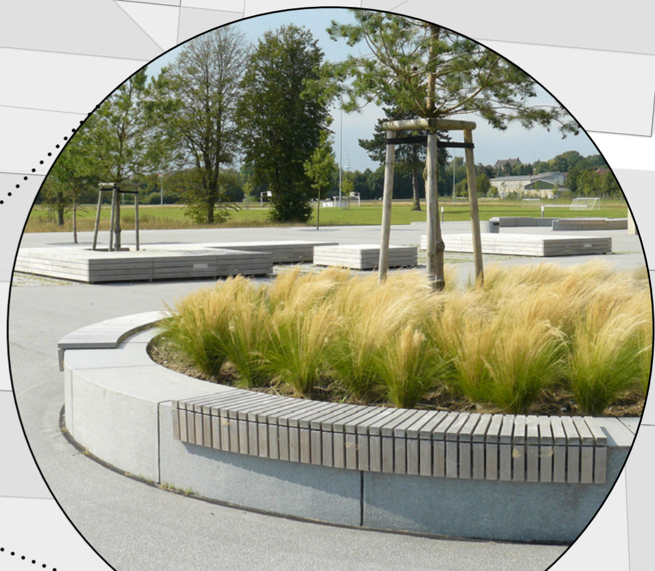
Festinstalliertes Pflanzbeet Größere Pflanzen und Bäume möglich