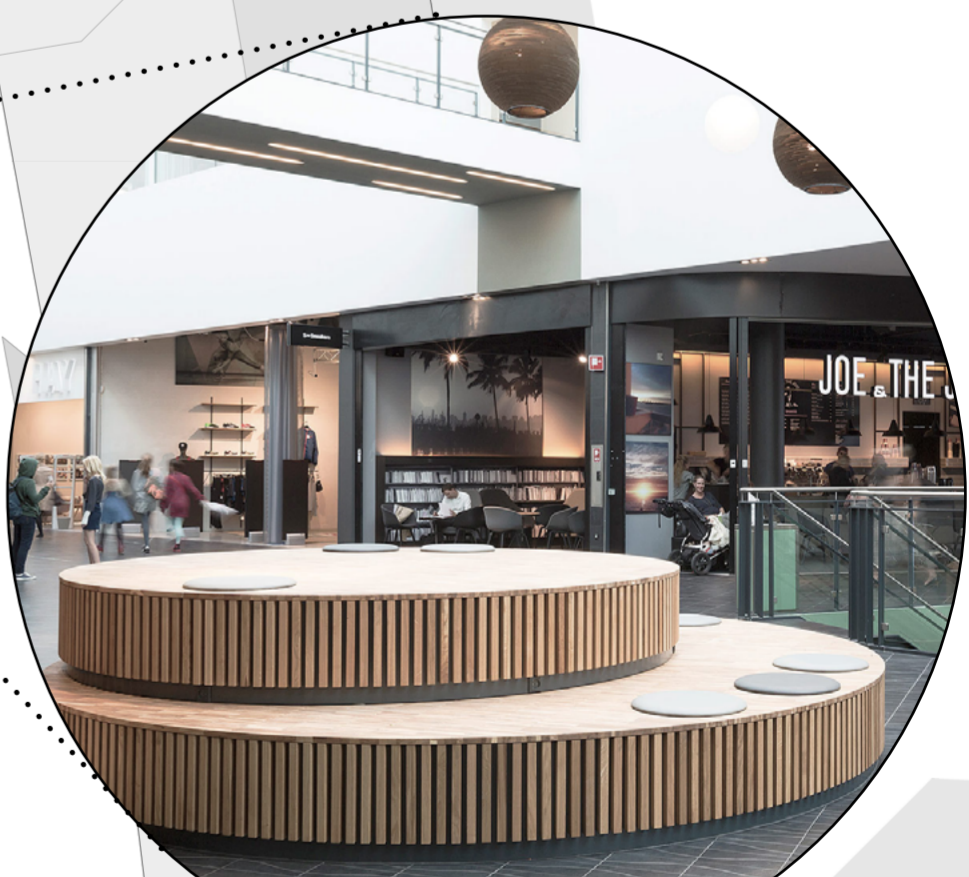
Mehrstufiges Sitzpodest zum Aufenthalt, Spielmöglichkeit und Blickfang