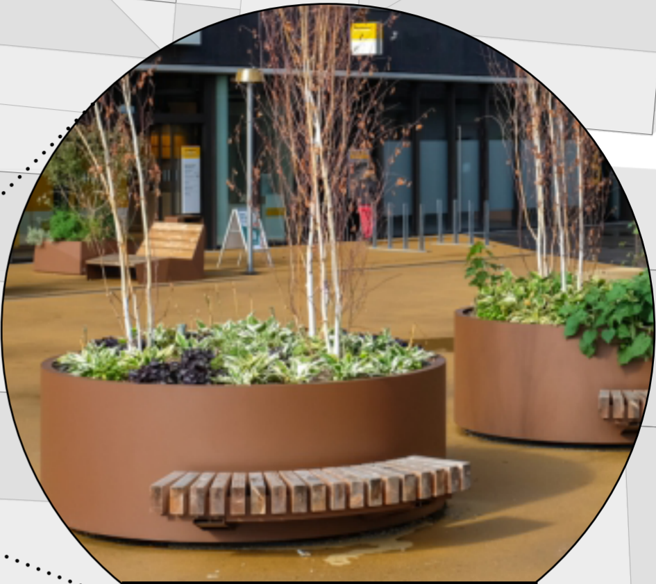
Semimobiles Pflanzbeet Kleinere Pflanzen und Strauch möglich

Verschiebung des Beetes zur Nienburger Straße. Wegfall von Fahrradbügeln