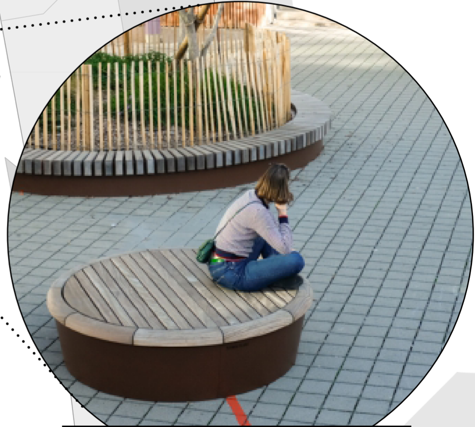
Semimobiles Sitzpodest Kleinere Sitzmöglichkeit, dafür versetzbar