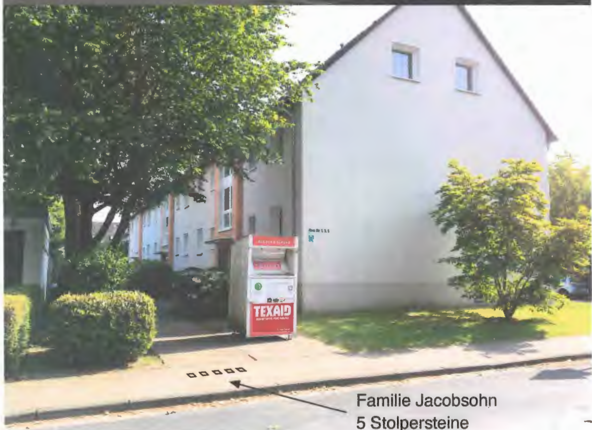
Familie Jacobsohn 5 Stolpersteine