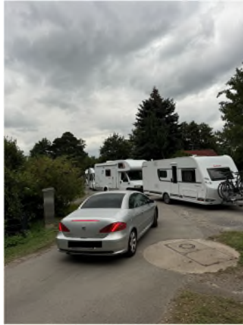
Bildmaterial zum Antrag