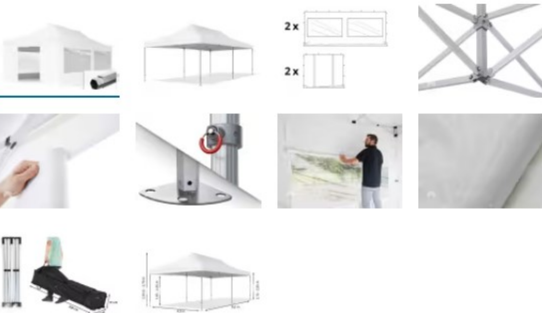
Abb. kann in Größe und Farbe abweichen