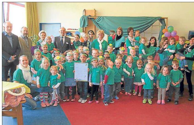
Auch im DRK-Kindergarten „Flohzirkus“ war die Freude über die Zertifizierung groß. In Sachen gesunder Ernährung sind die Erzieher und ihre Schützlinge Experten.