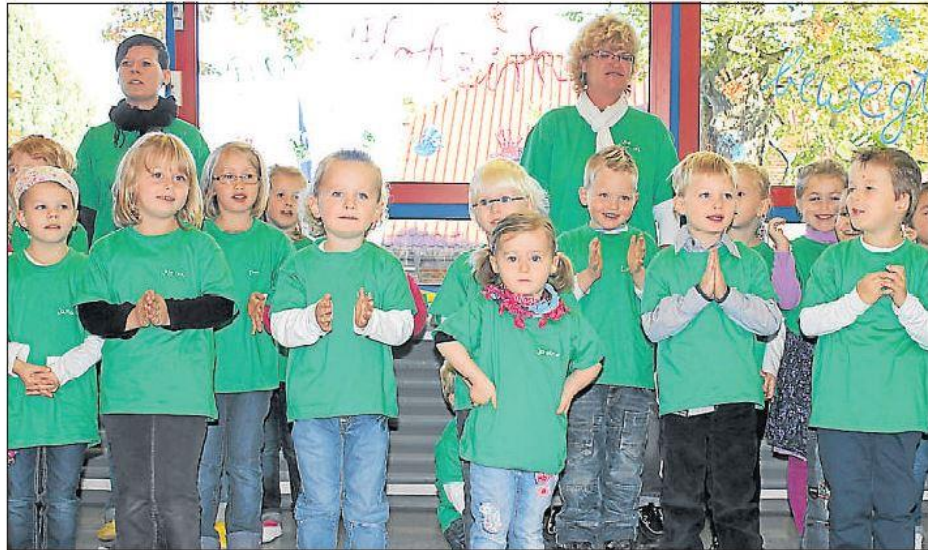
Mit Gesang und Tanz begrüßten die Kindergartenkinder am Samstagnachmittag die Gäste im „Flohzirkus“. Während einer kleinen Feier wurde die Einrichtung zum Bewegungskindergarten zertifiziert.