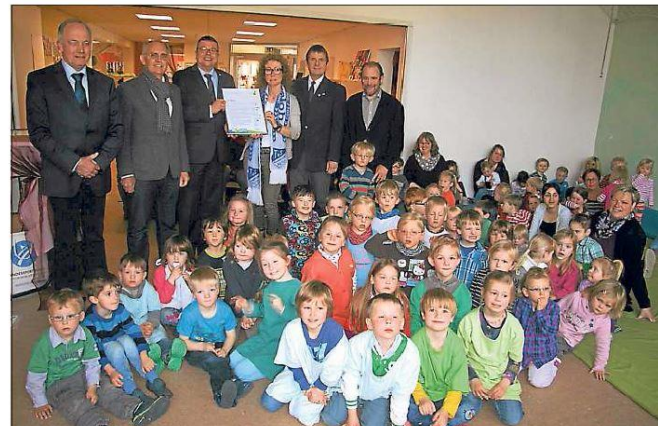
Stolz wird das neue Zertifikat „Pluspunkt Ernährung“ des Landessportbundes und der gesetzlichen Krankenkassen auch im DRK-Kindergarten in Wadersloh präsentiert.