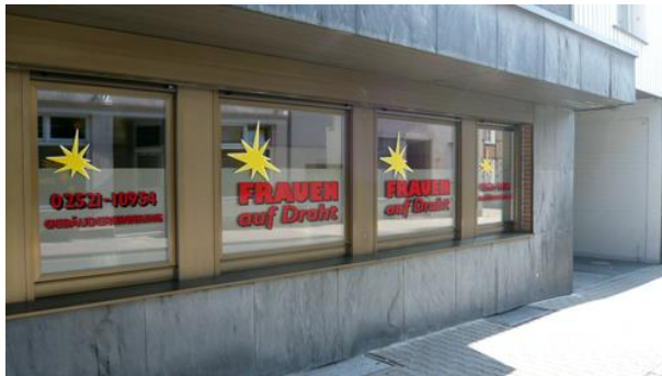
Büro Linnenstr. 28, 59269 Beckum