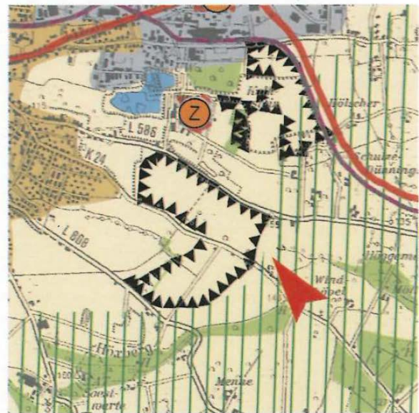
Abb. 10 Anregung