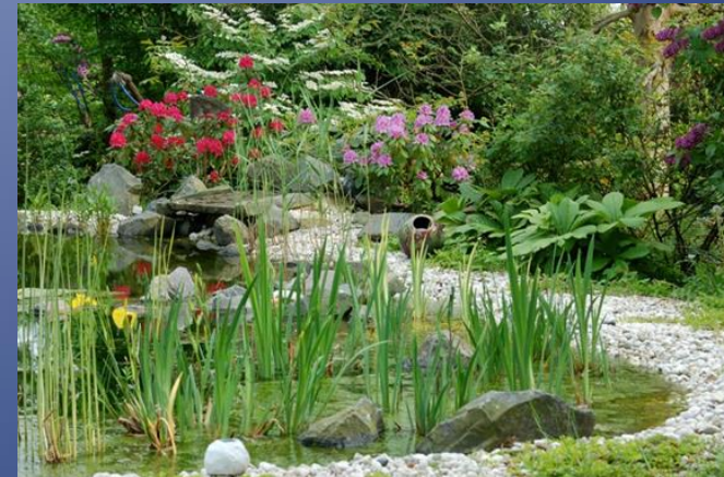
Exkursionen zur Gartenkultur