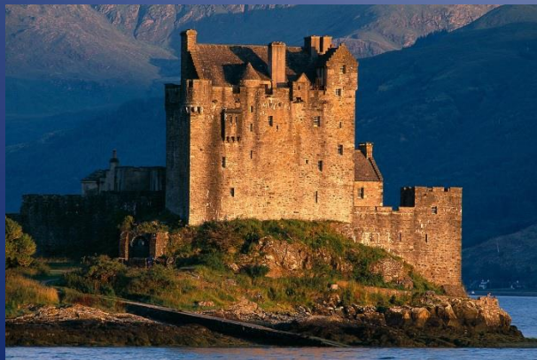
Multivisionsshows mit dem Alpenverein Sektion Beckum