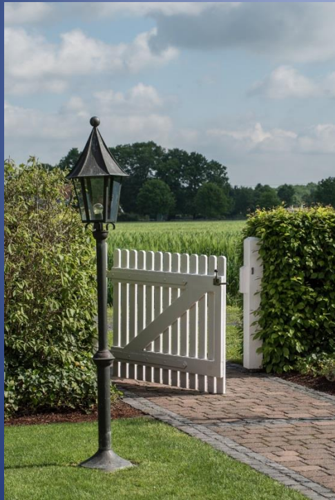
5. Landpartie zum Strukturwandel im Kreis Warendorf