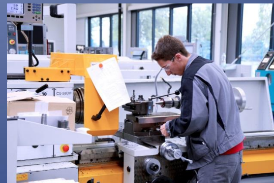
Betriebsbesichtigungen mit Heimatverein Neubeckum