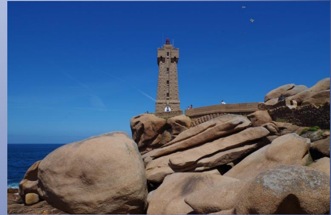
Länderkundliche Vorträge in der Landessprache