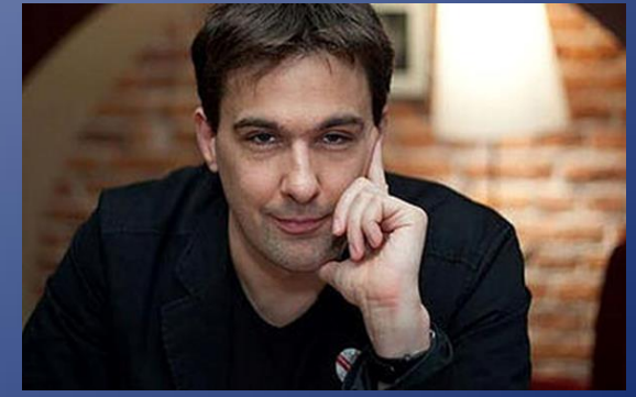
Boris Reitschuster: Herausforderung Russland