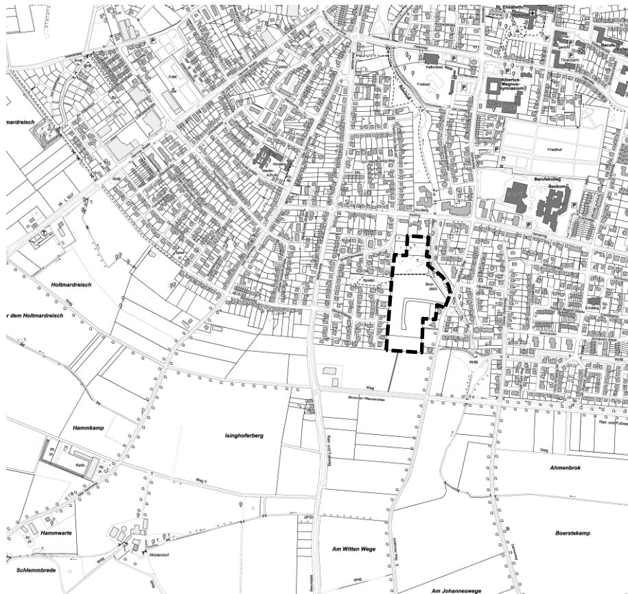
Abb 1: Abgrenzung des räumlichen Geltungsbereiches