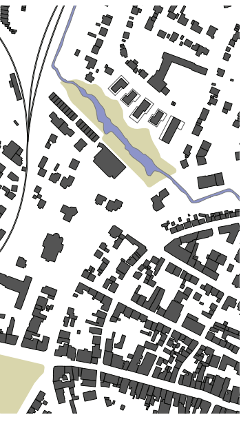
Schwarzplan M 1:2000