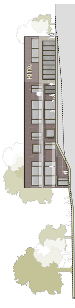
Ansicht | Süd | Anlage 1 zur Vorlage 2022/0169

Unser Vorschlag soll durch ein generationsübergreifendes, integratives, gemischtes und ökologisch nachhaltiges Quartier einen positiven Beitrag für Beckum leisten. Wir freuen uns auf weitere Abstimmungsgespräche mit der Gemeinde Beckum. Die angrenzenden Grundstücke sind jedoch für eine weitere Wohnnutzung vorgesehen und sind in der Planung als "Zusiedlungs- und Möglichen" für den preis-gedämpften Wohnungsbau.