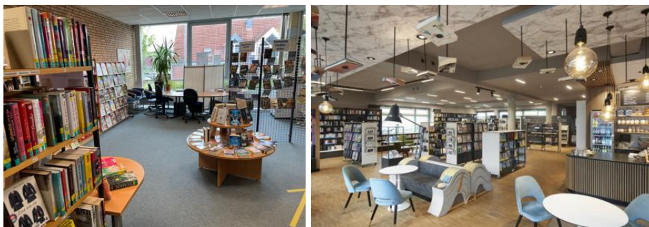
Abbildungen 2 und 3: Links: Aktuelle Einrichtung der StB Neubeckum, Rechts: Neue Erlebnisbücherei mit Café im Stadtteil Esting (2.000 EW) der Stadt Olching, Bayern

Diese Nennungen erfolgten in ähnlicher Form auch im Rahmen der Online-Befragung der Bildungspartner*innen . Als Top-Priorität bei der künftigen Gestaltung gaben hier 80% der Teilnehmenden die Schaffung einer angenehmen Atmosphäre mit Aufenthaltscharakter an. Durch das Beratungsunternehmen wird daher ein Raumprogramm erarbeitet werden. Bereits jetzt wird deutlich, dass erhebliche Potenziale in einer räumlichen Verbindung mit dem nebenan liegenden Freizeithaus bestehen würden (Wanddurchbruch).