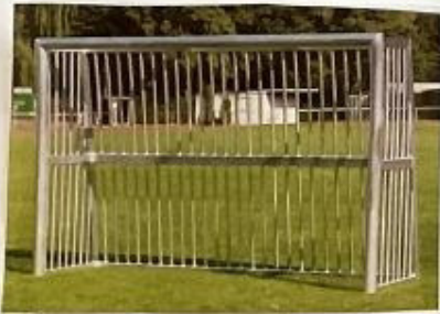
kleines Fußballfeld Rasen