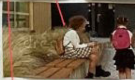
Hochbeet mit Sitzmögl. daneben, Weg-Abgrenzung