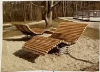
liegen auf der wiese