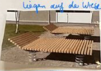
liegen auf der wiese