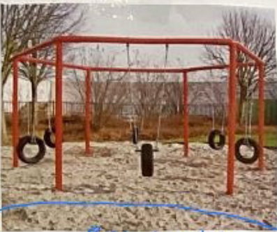
8-Eck-Schaukel einen Basketballkorb gibt es schon Lichtanlage