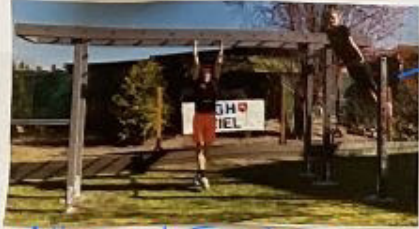
Kletter- und Turnstangen