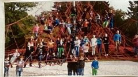
große Kletterspinne mit Holzschmipselboden