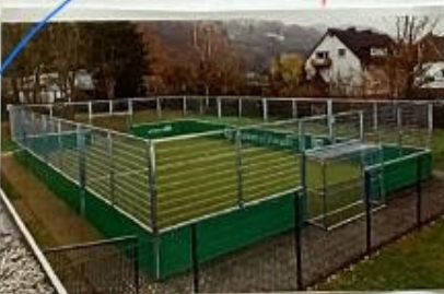
Fußballfeld abschließbar Kunstgras